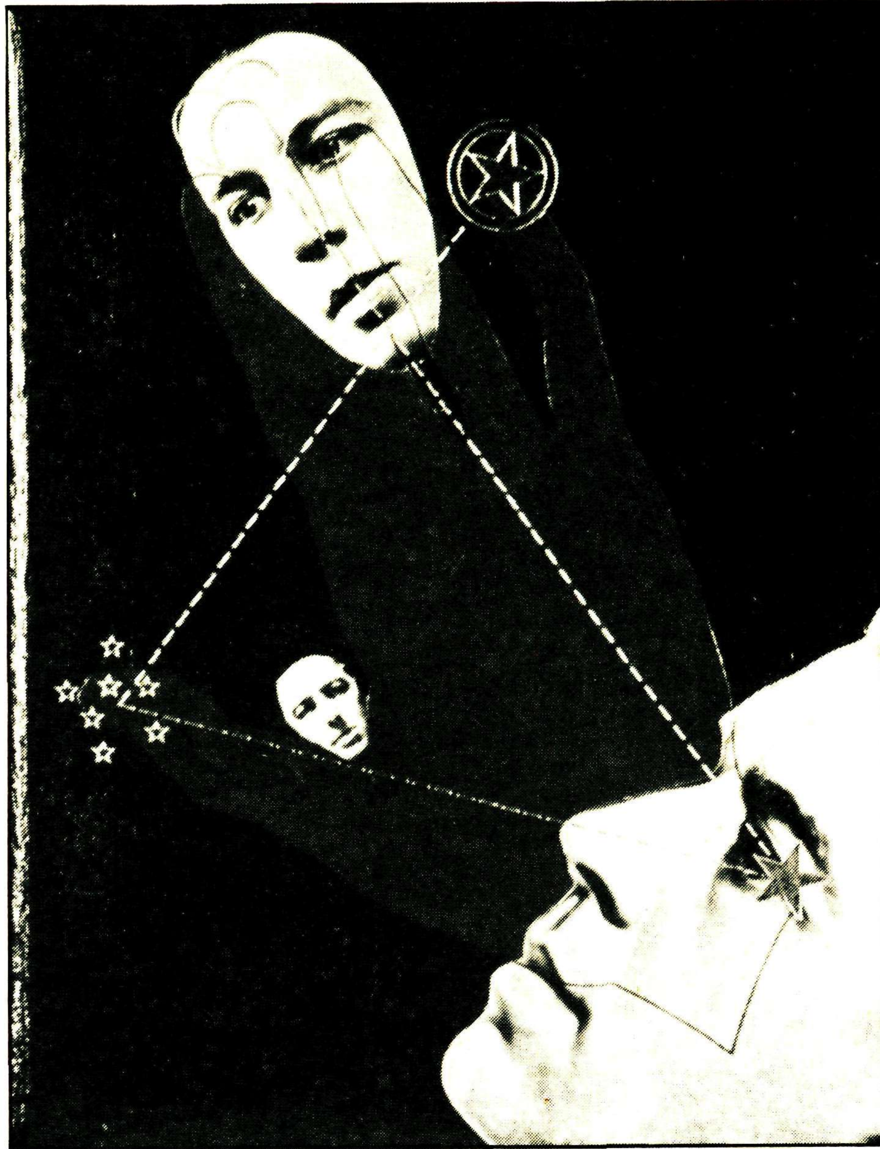
Βιβλιοδεσία του Ρ. αλ Βεσιελ, 1934 (από το βιβλίο «Βιβλιοδεσία: τέχνη και τεχνική» των Ανδρέα Χρ. Γανιάρη και Φρόσως Α. Γανιάρη).