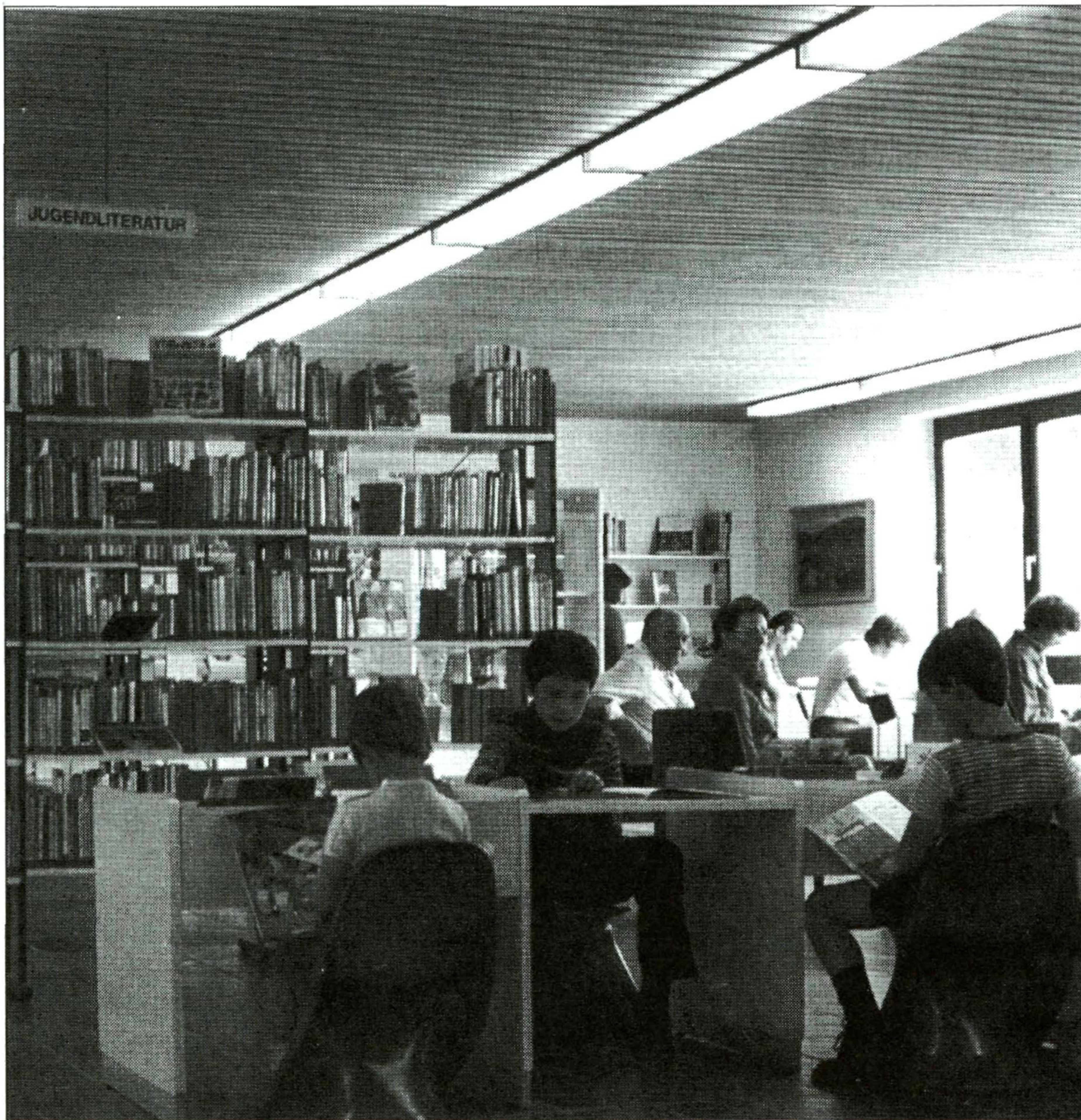
Λείπει ολόκληρη η αναγκαία υποδομή πάνω στην οποία μπορεί να στηριχτεί μια αναγνωστική πολιτική

Τέλος, το τέταρτο ερώτημα, γιατί θα πρέπει να τεθεί κι αυτό, είναι αν εκείνοι που αποτελούν αντικείμενο μιας τέτοιας πολιτικής τη χρειάζονται, ή μάλλον αν έχουν δεδηλωμένη