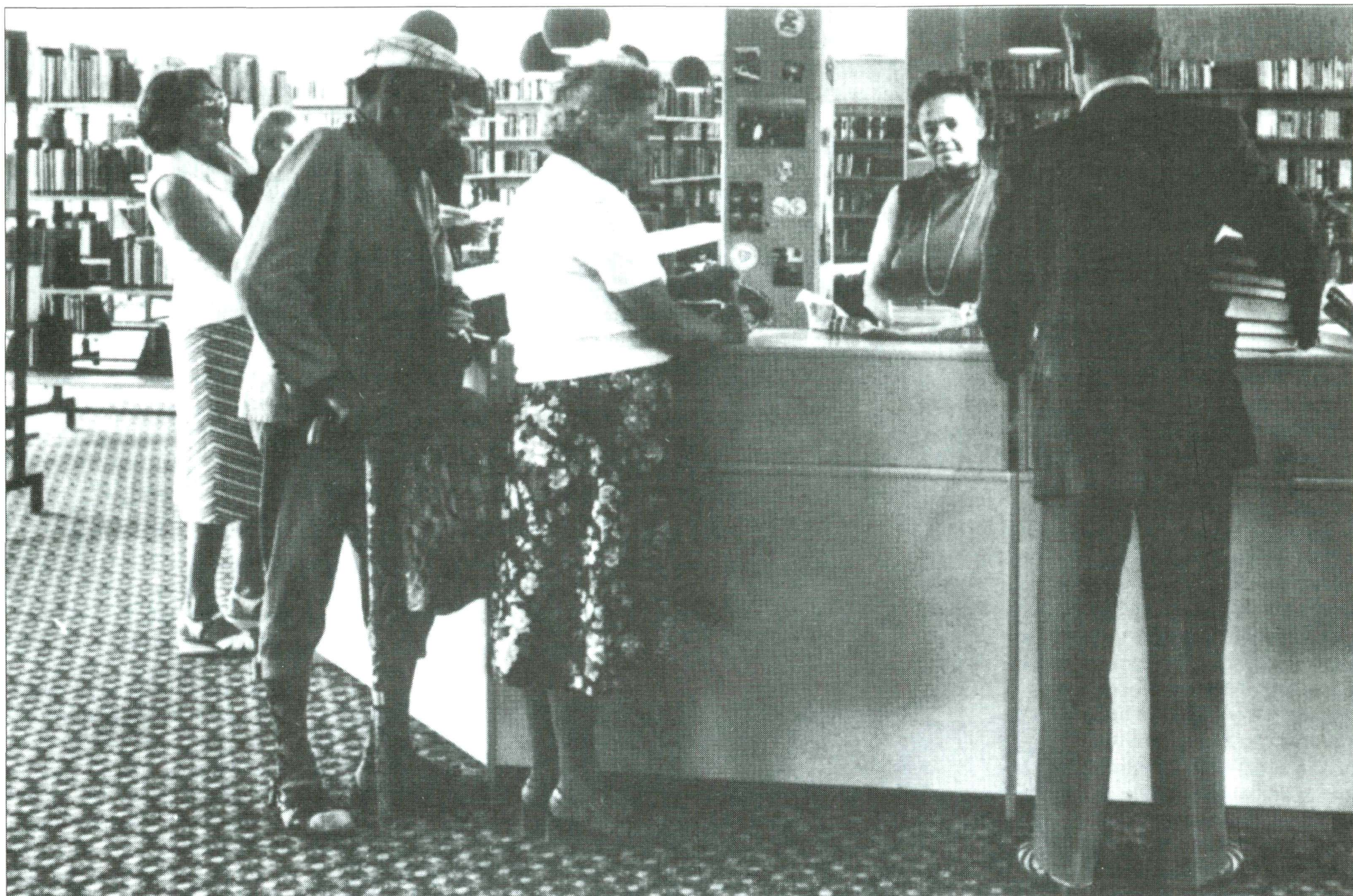
Για να υπάρξει μια πολιτική ανάγνωσης για τους νέους απαιτείται σχεδιασμός και ρητά εκφρασμένη πολιτική

στις εγγενείς κρίσεις που μαστίζουν κατά καιρούς την εκδοτική ζωή. Δυστυχώς όμως, στη χώρα μας δεν είναι ακόμη ορατή η άσκηση ούτε της μιας πολιτικής ούτε της άλλης. Ούτε μιας πολιτικής βιβλίου ούτε μιας πολιτικής ανάγνωσης και απλώς έχουμε το φαινόμενο να δαπανώνται κάποια ποσά για την αγορά βιβλίων εξυπηρετώντας όμως εντελώς διαφορετικούς στόχους, όπως λ.χ. πελατειακές σχέσεις. Οπωσδήποτε, για να υπάρξει μια πολιτική ανάγνωσης για τους νέους απαιτείται ακόμη αρκετή ορθολογικοποίηση, σχεδιασμός και ρητά εκφρασμένη πολιτική, καθαροί και μετρήσιμοι στόχοι, κατάλληλα μέσα και συντονισμός. Μας λείπει ακόμη ο κατάλληλος φορέας, ένα Κέντρο καθ' ύλην αρμόδιο για μια αναγνωστική πολιτική, με αυτονομία και χρήματα. Μας λείπει ένα κατάλληλο δίκτυο βιβλιοθηκών, πολιτιστικών κέντρων, κέντρων τεκμηρίωσης και τραπεζών πληροφοριών. Λείπουν τα προγράμματα και οι καμπάνιες προσέλκυσης νέων αναγνωστών. Με λίγα λόγια, λείπει ολόκληρη η αναγκαία υποδομή πάνω στην οποία μπορεί να στηριχτεί μια αναγνωστική πολιτική για