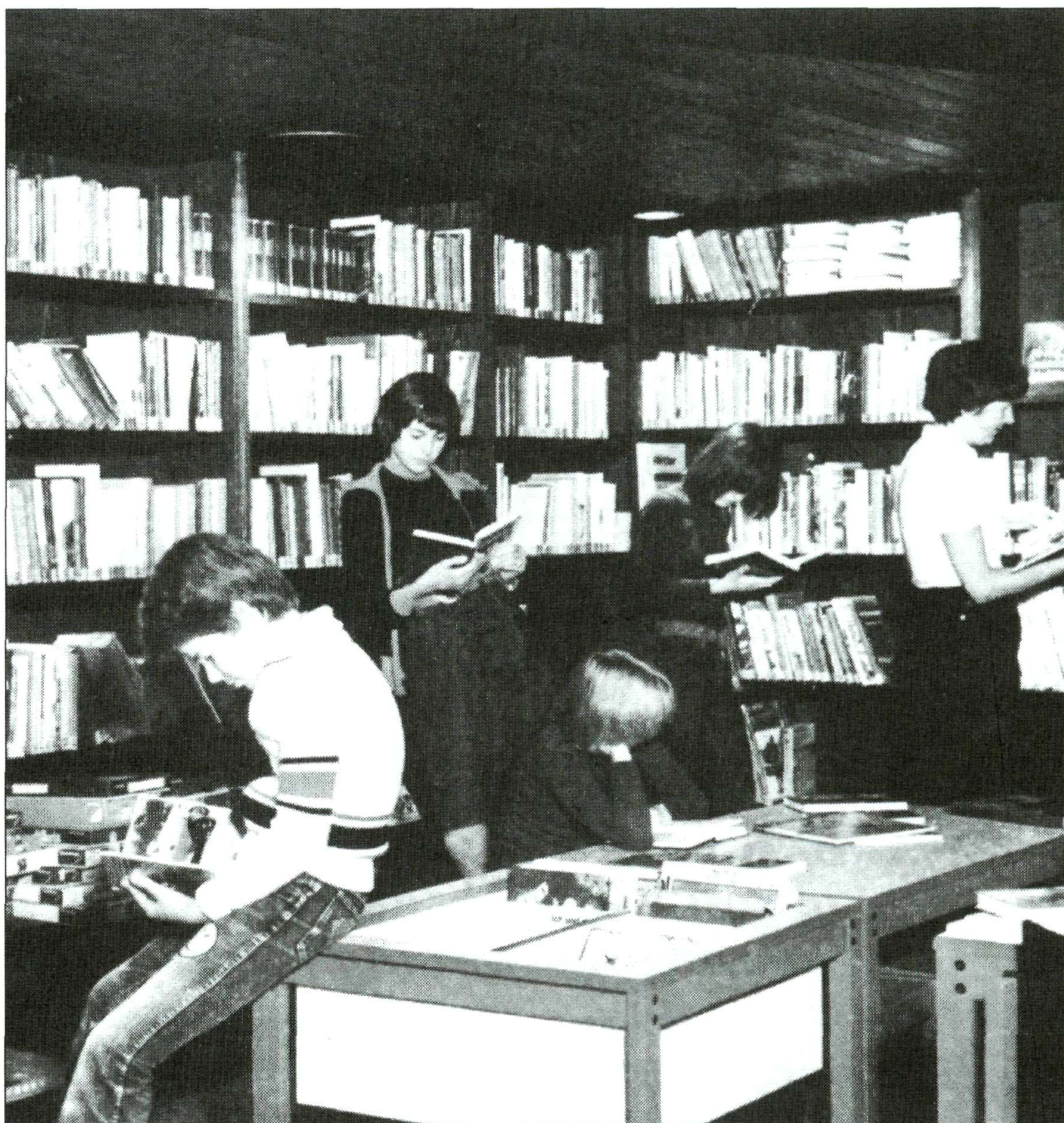
Μας λείπει ένα κατάλληλο δίκτυο βιβλιοθηκών, πολιτιστικών κέντρων, κέντρων τεκμηρίωσης και τραπεζών πληροφοριών

"..τα αιτήματα των εκδοτών απέναντι στο κράτος πρακτικά κατευθύνονται πάντοτε σχεδόν σε μια πολιτική βιβλίου, που έχει πιο άμεσα οφέλη και όχι σε μια πολιτική ανάγνωσης, για την οποία μιλούμε με ουμανιστικούς όρους αλλά λίγα κάνουν πρακτικά...!"