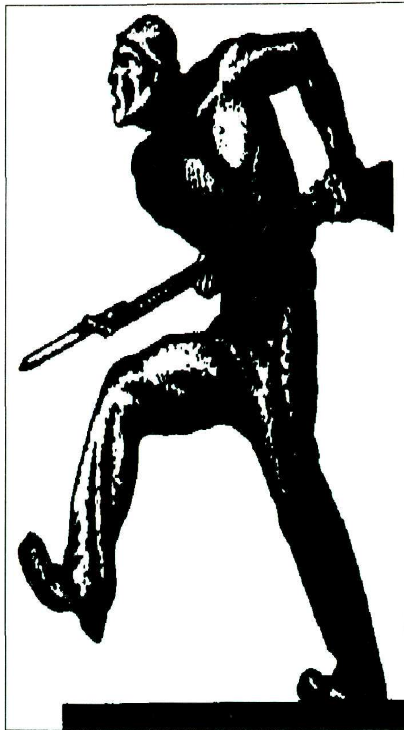
Ο διαδανεισμός των περιοδικών μεταξύ βιβλιοθηκών επεκτείνεται επειδή εξοικονομούνται πόροι που μπορούν να διατίθενται σε άλλους σκοπούς

Το συνέδριο άνοιξε με την εισαγωγική ομιλία του ο πρόεδρος της Ένωσης Ολλανδών Βιβλιοθηκονόμων Dr. Gerard van Marle, ο οποίος τόνισε ότι οι τεχνολογίες για την προώθηση της πληροφορησης δημιουργούν νέες ευκαιρίες, αλλά συγχρόνως εγκυμονούν κινδύνους. Οι αριθμοί δείχνουν αύξηση των τίτλων περιοδικών σε CD-ROM και μείωση του αριθμού των ευρωπαϊκών επιστημονικών περιοδικών. Τα περιοδικά σε ηλεκτρονική μορφή που διαδίδονται μέσω δικτύων, εκτός από τα πλεονεκτήματα (επικαιρότητα, αμεσότητα πρόσβα-