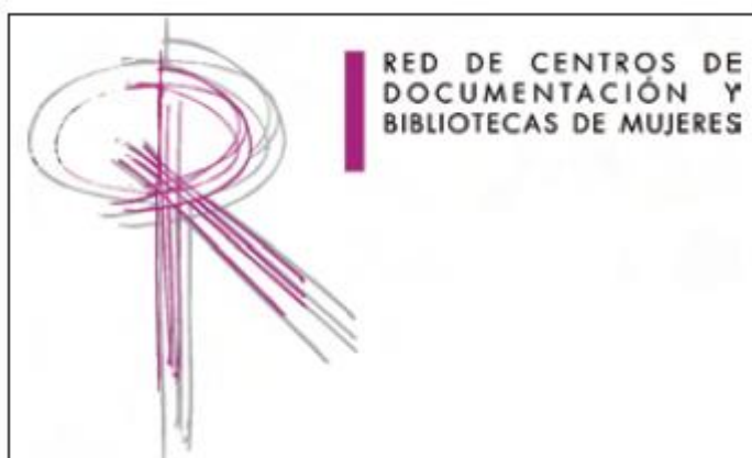
Εικόνα 1. Λογότυπο του Δικτύου Κέντρων Τεκμηρίωσης και Βιβλιοθηκών για τη Γυναίκα.