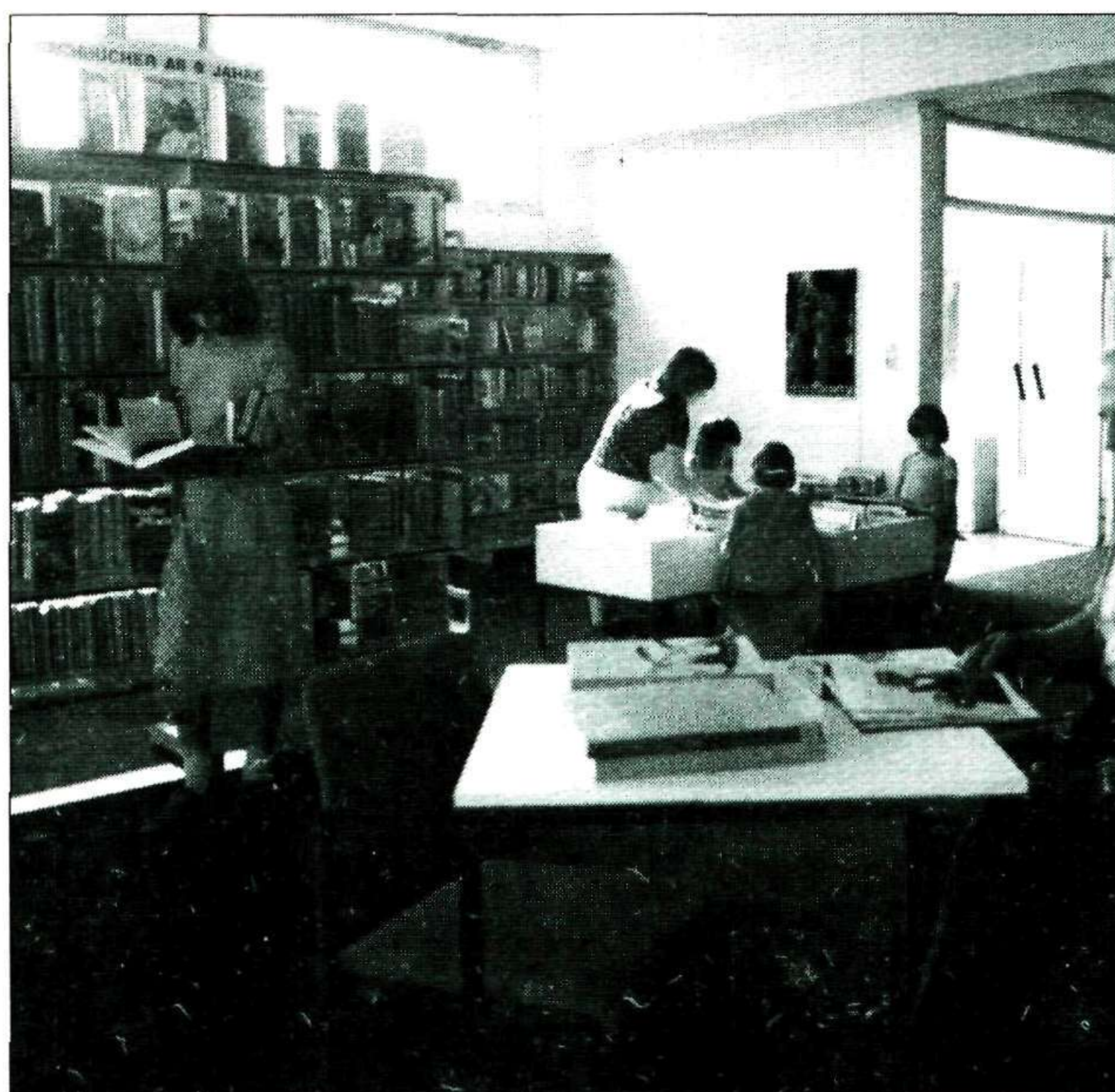
Στόχος των βιβλιοθηκαρίων θα πρέπει πάντα να είναι η πρόκληση νέων αναγνωστών

Αντίθετα, στις κοινωνικές επιστήμες (κωδικός 300), γίνεται διάσπαση της συλλογής ανάλογα με το θέμα όπως: "εργαζόμενοι", "οικονομία-κοινωνία", "παιδί και οικογένεια" κλπ.