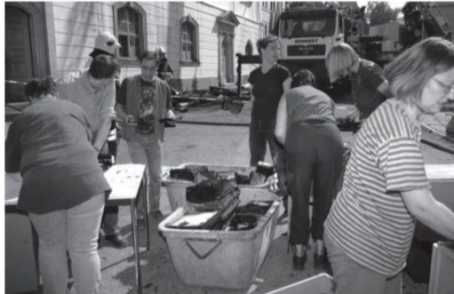
Εικόνα 3: Βασική φροντίδα των κατεστραμμένων βιβλίων