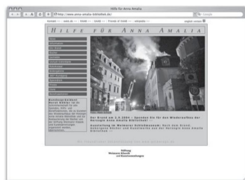
Εικόνα 4: Ιστοσελίδα της βιβλιοθήκης, η οποία δημοσιεύτηκε στις 21.09.2004

Εργασία 3) Στις 7 Σεπτεμβρίου ο πρόεδρος του Ιδρύματος – η Βιβλιοθήκη αποτελεί τμήμα του Ιδρύματος Klassik Stiftung Weimar – σύστησε την ομάδα εργασίας για τις δημόσιες σχέσεις, για να εγκαινιάσουν τη μεγάλη εκστρατεία δωρεών που ίσχυε στις βιβλιοθήκες της Γερμανίας. Ο ομοσπονδιακός πρόεδρος είχε εγκρίνει ήδη από τις 5 Σεπτεμβρίου την προσασία της συγκέντρωσης για τις δωρεές, η οποία αποδείχθηκε μεγάλη βοήθεια. Ένα γραφείο δωρεών με συνεργάτιδες σύμβασης έργου ανέλαβαν τη δουλειά πέντε μέρες μετά την πυρκαγιά για να μπορέσουν να ανταποκριθούν στις πολυάριθμες ερωτήσεις και τις προσφορές από όλο τον κόσμο. Την πρώτη εβδομάδα ήταν ήδη εκατοντάδες, ένα χρόνο αργότερα είχαν εγγραφεί 18.000 δωρητές. Το γραφιστικό γραφείο της Βαϊμάρης έφτιαξε αφιλοκερδώς μian ιστοσελίδα με πληροφορίες για την πυρκαγιά, κατασκευάζονταν φέιγ-βολάν που καλούσαν δωρητές, σχεδιάστηκαν φιλανθρωπικές ενέργειες και δημοσιεύτηκε ένα βιβλίο 1 .