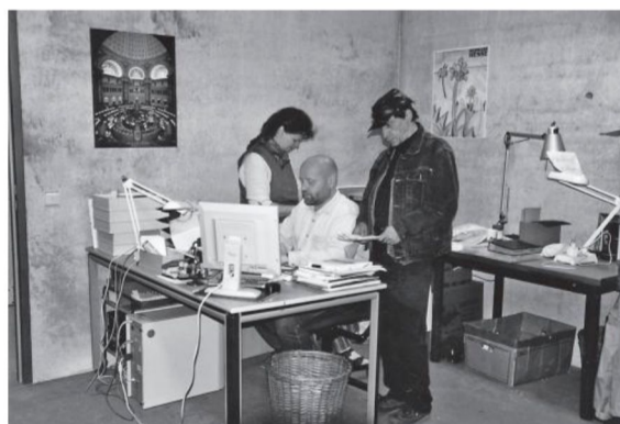
Εικόνα 2: Προσωρινοί χώροι εργασίας στο υπόγειο βιβλιοστάσιο

Τη Δευτέρα στις 8 το πρωί μετά την πυρκαγιά που ξέσπασε το βράδυ της Πέμπτης, συγκεντρωθήκαμε όλοι οι συνάδελφοι στον υπαίθριο χώρο πίσω από τη Βιβλιοθήκη, ένα ηλιόλουστο πρωινό μιας ζεστής ημέρας του Σεπτεμβρίου. Εκεί συζητήθηκαν τα πιο επείγοντα ζητήματα: η περαιτέρω περισυλλογή των βιβλίων από την κατά τα λοιπά πλήρως κατεστραμμένη εστία της πυρκαγιάς, καθώς επίσης και η αναζήτηση και ο εξοπλισμός νέων γραφείων για τους 'άστεγους' συναδέλφους.