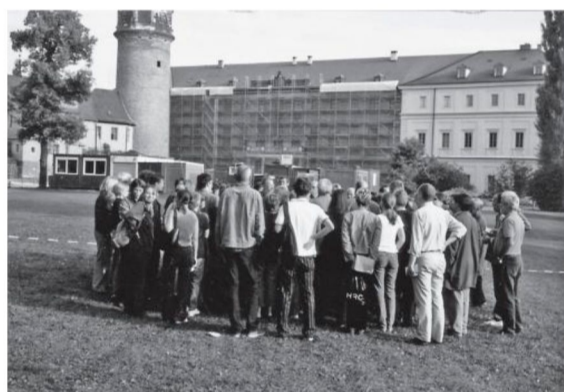
Εικόνα 1: Συγκέντρωση του προσωπικού στην υπαίθρο

Ποια μέτρα οργάνωσης έπρεπε να ληφθούν γρήγορα για να μπορέσει το θέμα να αντιμετωπιστεί μετά την πυρκαγιά μέχρι ενός σημείου; Υπό ποιες δομικές προϋποθέσεις μπορούσε να ανοικοδομηθεί; Αρχικά κάποια ενδεικτικά στοιχεία: η πυρκαγιά κατέστρεψε τα γραφεία 40 εκ των 80 υπαλλήλων. Ακόμα και το δικό μου γραφείο μπορεί να μην καταστράφηκε, αλλά δεν μπορούσε πλέον να λειτουργεί. Αυτό σημαίνει ότι δεν μπορούσαν να χρησιμοποιηθούν το φαξ, οι υπολογιστές, τα τηλέφωνα και γενικά όλη η υποδομή. Επίσης η πυρκαγιά ξέσπασε τη χρονική στιγμή που είχε σχεδιαστεί η ανακαίνιση του ιστορικού κτηρίου, είχε γίνει προετοιμασία για τη μεταφορά των βιβλίων και είχαν οριστεί τα εγκαίνια της επέκτασης του κτηρίου για τις 4 Φεβρουαρίου 2005.