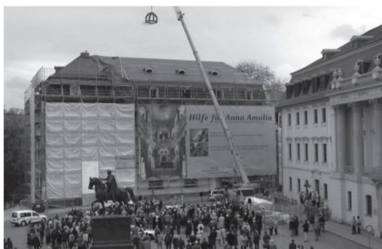
Εικόνα 7: Εορτασμός Richtfest στις 24.10.2005

ανακτηθούν αντίτυπα από παλαιοβιβλιοπωλεία και δημοπρασίες. Οι προσπάθειες έγιναν με την υποστήριξη της βιβλιοθήκης του Δούκα August του Wolfenbüttel, της δημοτικής βιβλιοθήκης του Mainz, της πανεπιστημιακής βιβλιοθήκης του Kassel, της βιβλιοθήκης Georgius Agricola στο Freiberg/Sachsen κ.ά., οι οποίες απέστειλαν τα βιβλία που είχαν διπλά ως δωρεά. Η βάση δεδομένων με τις απώλειες έγινε ημιαυτόματα με τη βοήθεια του Κεντρικού Καταλόγου Παλαιών Βιβλίων (ZVAB) για να βρεθούν ευκολότερα τα διαθέσιμα στην αγορά βιβλία και να γίνει εν ανάγκη παραγγελία αυτών.