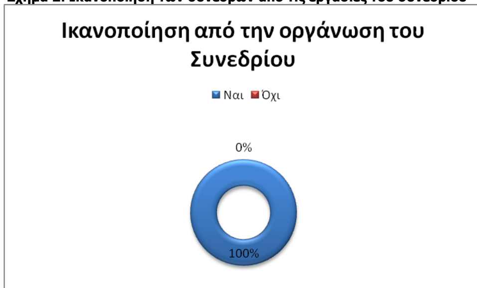
Σχήμα 2: Ικανοποίηση των συνέδρων από τις εργασίες του συνεδρίου

Στην επιτυχία της διεξαγωγής συνέβαλε η άριστη συνεργασία των μελών της επιστημονικής και οργανωτικής επιτροπής αλλά και των επιτροπών μεταξύ τους.