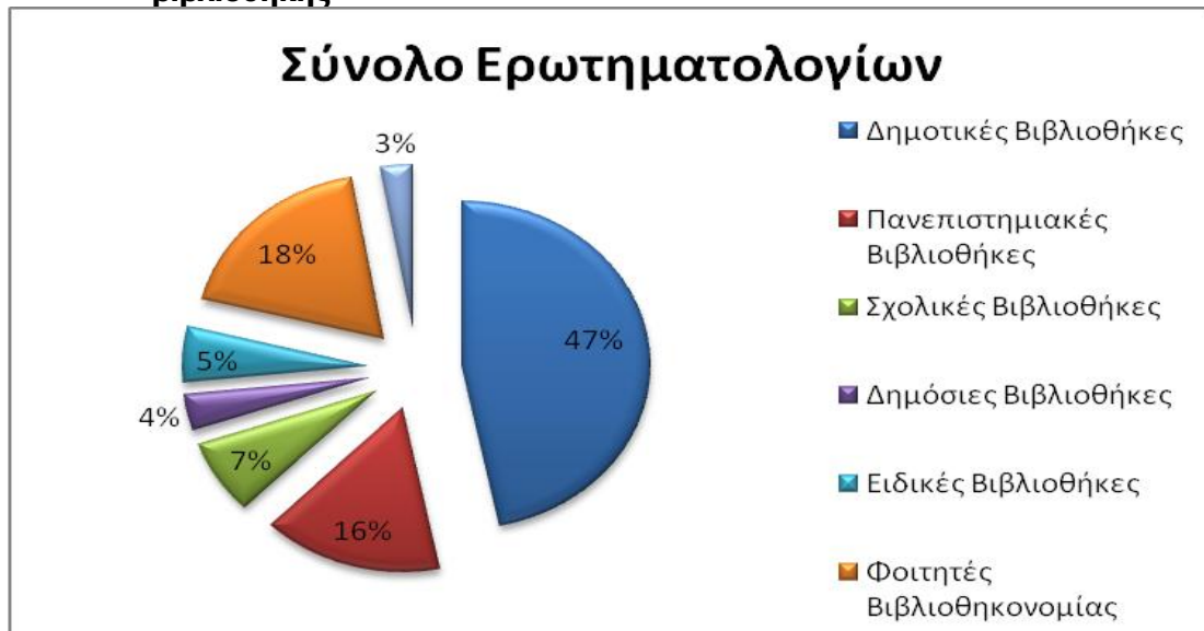
Σχήμα 1: Βιβλιοθηκονόμοι που παρακολούθησαν το συνέδριο ανά είδος βιβλιοθήκης

Προκύπτει επίσης ότι το συνέδριο παρακολούθησαν βιβλιοθηκονόμοι από πανεπιστημιακές, σχολικές και ειδικές βιβλιοθήκες. Ενθαρρυντικό για τον κλάδο είναι ότι ένα σημαντικό ποσοστό (18%) των συνέδρων το αποτελούσαν σπουδαστές των τμημάτων βιβλιοθηκονομίας, γεγονός που αποδεικνύει τον προβληματισμό και τον επαγγελματισμό των μελλοντικών επαγγελματιών του κλάδου.