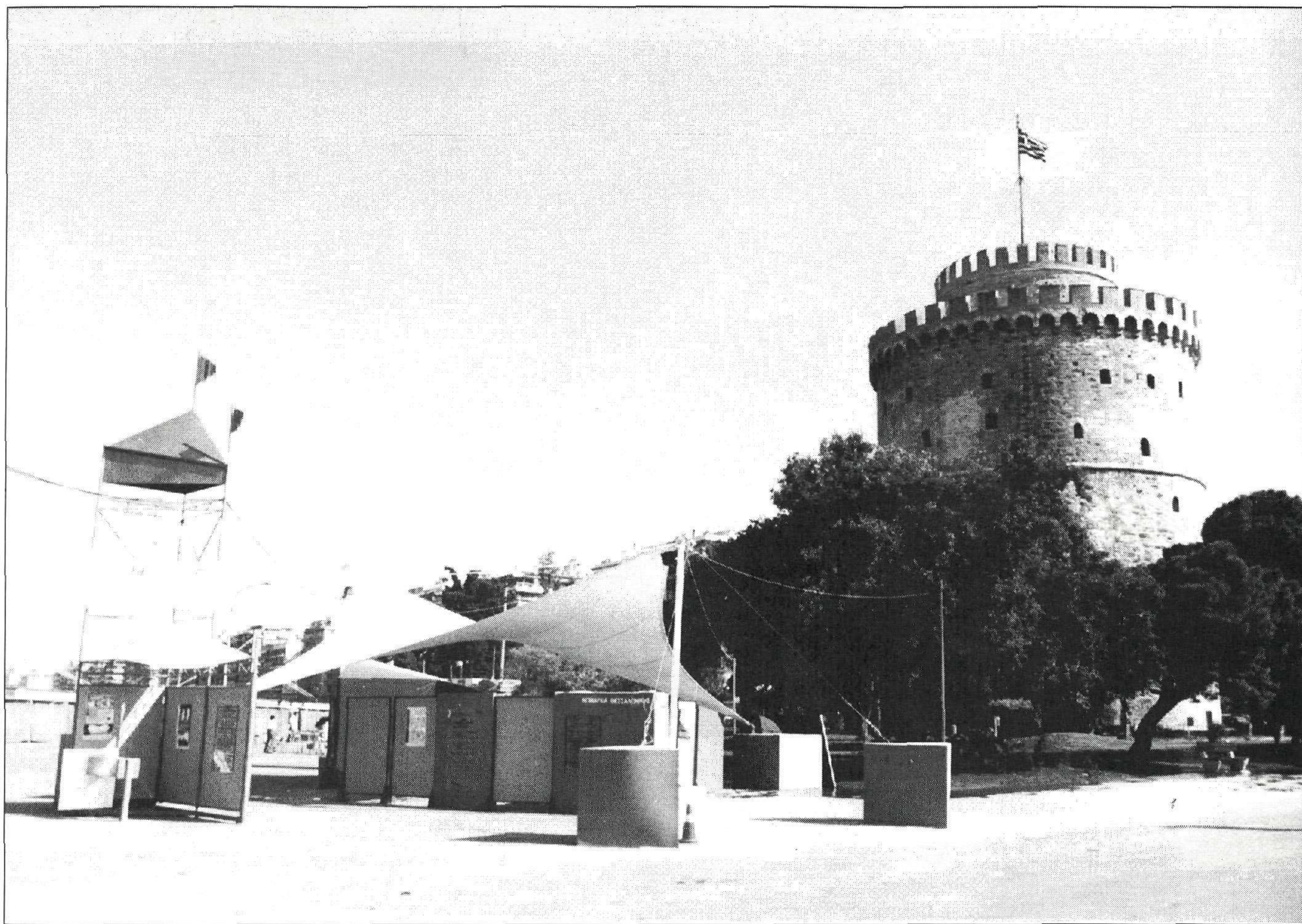
Το περίπτερο της Νομαρχίας στο Φεστιβάλ Βιβλίου

Μ ε ένα πρόγραμμα για την προβολή και την προώθηση του βιβλίου και της ανάγνωσης μ' ένα "Καλημέρα Βιβλίο" άρχισε (21 Μαΐου) και ολοκληρώθηκε στις 5 Ιουνίου μια σειρά πρωτοβουλιών της Νομαρχίας Θεσσαλονίκης στο χώρο του Πολιτισμού.