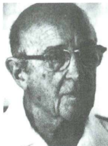
Carl Rogers ➤