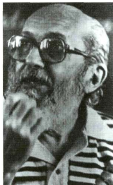
Paulo Freire ➤ Ivan Illich ▼