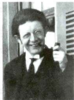
Jean Piaget ➤