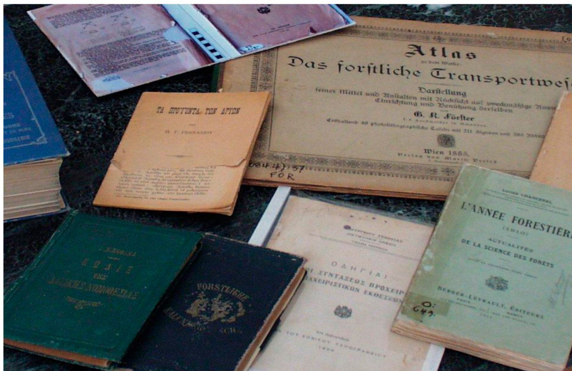
Σχήμα αρ. 5

Το 2005 ξεκίνησε η διαδικασία ψηφιοποίησης υλικού αυτοτελών εκδόσεων είτε με τη χρήση σαρωτών είτε με φωτογράφιση ( Σχήμα 5 ).