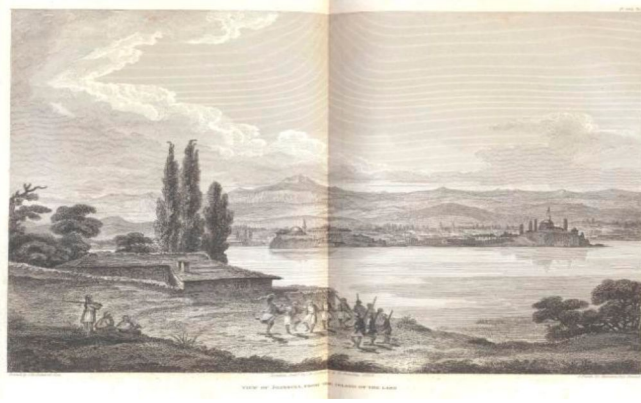
Εικόνα 1: Χαρακτικό με τίτλο «View of Ioannina, from the island of the lake»