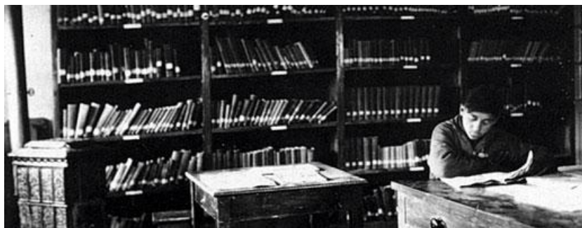
Η Βιβλιοθήκη τη δεκαετία του 1930

Η προσωπική συλλογή του ιδρυτού της Σχολής απετέλεσε και την πρώτη βιβλιοθήκη της. Η συλλογή αυτή αποτελούνταν από βιβλία στην πλειοψηφία τους στην αγγλική γλώσσα και ήταν αγροτικού και κτηνοτροφικού ενδιαφέροντος.