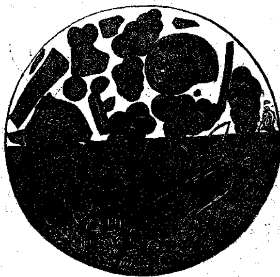
Τεμάχιον λευκίτιδος θεώμενον διὰ μικροσκοπίου.

εὐκινῆσαι τοῦ κόματος. Ἐγκαταί ἔχουσιν ἀφεθῆ εἰς τὸ πάθος τῶν ταξειδίων. Ὅταν οἱ κάτοικοι πόλεως τινος ἐπληθύνοντο ἀναφορικῶς πρὸς τὴν τρέφουσαν αὐτοὺς χώραν, ἔσπαυδον νὰ ἀποστείλωσιν ἀποικίας ὡς φωλεὰ μελισσῶν· διέτρεχον τὰς ὄχθας τῆς Μεσογείου, ἵνα εὐρωσι θέσιν ἀναπολοῦσαν εἰς αὐτοὺς τὴν πατρίδα καὶ ἀνεγείρωσιν ἐν αὐτῇ νέαν ἀκρόπολιν. Οὕτως ἀπὸ τῆς Μαιώτιδος λίμνης μέχρις ἐντεῦθεν τῶν Ἡρακλείων στηλῶν καὶ ἀπὸ τῆς Τανάτιδος καὶ τοῦ Παντικαπαίου μέχρι Κάδικος καὶ Τίγγιος ἀνέτελλον παντοῦ ἑλληνικαὶ πόλεις. Χάρις δὲ εἰς τὰς διασπαρμένας ταύτας ἀποικίας, πολλαὶ τῶν ὁποίων ὑπερέρρησαν καὶ τὰς μητροπόλεις τῶν κατὰ πολὺ καὶ κατὰ τὴν δόξαν καὶ κατὰ τὴν δύναμιν, ἢ καθαυτὸ Ἑλλὰς, ἢ Ἑλλὰς τῶν ἐπιστημῶν, τῶν τεχνῶν καὶ τῆς δημοκρατικῆς αὐτονομίας ἐτελεύτησεν, ἀφ' οὗ ἐξεχειλίσεν εὐρέως ἐκτὸς τῆς κοιτίδος τῆς καὶ κατέλαβε διά-