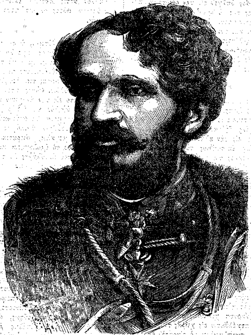
Ὁ Κόμης ΑΝΔΡΑΣΗΣ

Ταύτην τὴν στιγμὴν ἡ θύρα τῆς κομψῆς κατοικίας τῆς κυρίας Ρεϊνόρου ἦνοιξεν, ὑπερέτης δὲ ἐξελθὼν κατεπευσμένως ἔλαβε τὸν νεὸν βραχίονα τοῦ νεανίσκου, και ἐσυρὲν αὐτὸν βαρθούμενος ὑπὸ τοῦ κλητῆρος εἰς