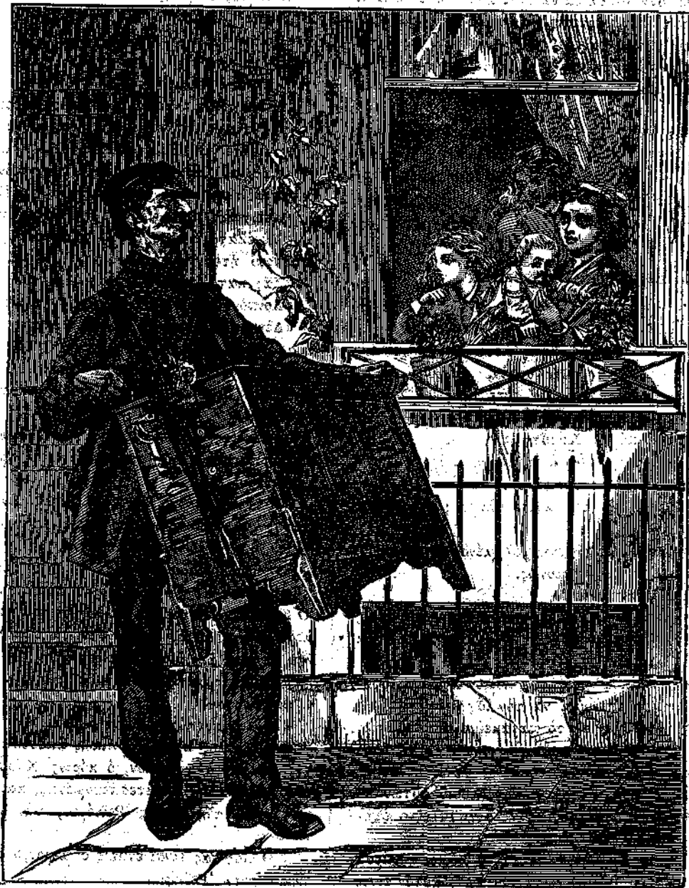
Ὁ πλάνης Ἰταλός. (Ἰδὲ σελ. 135).

Ῥεϊνόρου μὲ βλέμμα ἀπελπιστικόν· «τίνα χρῆσιν θὰ κάμῃ τόσων πολλῶν χρημάτων;» «Ὅχι καλὴν βεβαίως χρῆσιν,» ἀπήντησεν ὁ κύριος Χάρδης. «Μὴ τῶ τὰ δίδῃτε,» εἶπεν ἡ κυρία Ρεϊνόρου, μετὰ πολλῆς συγγινῆσεως.