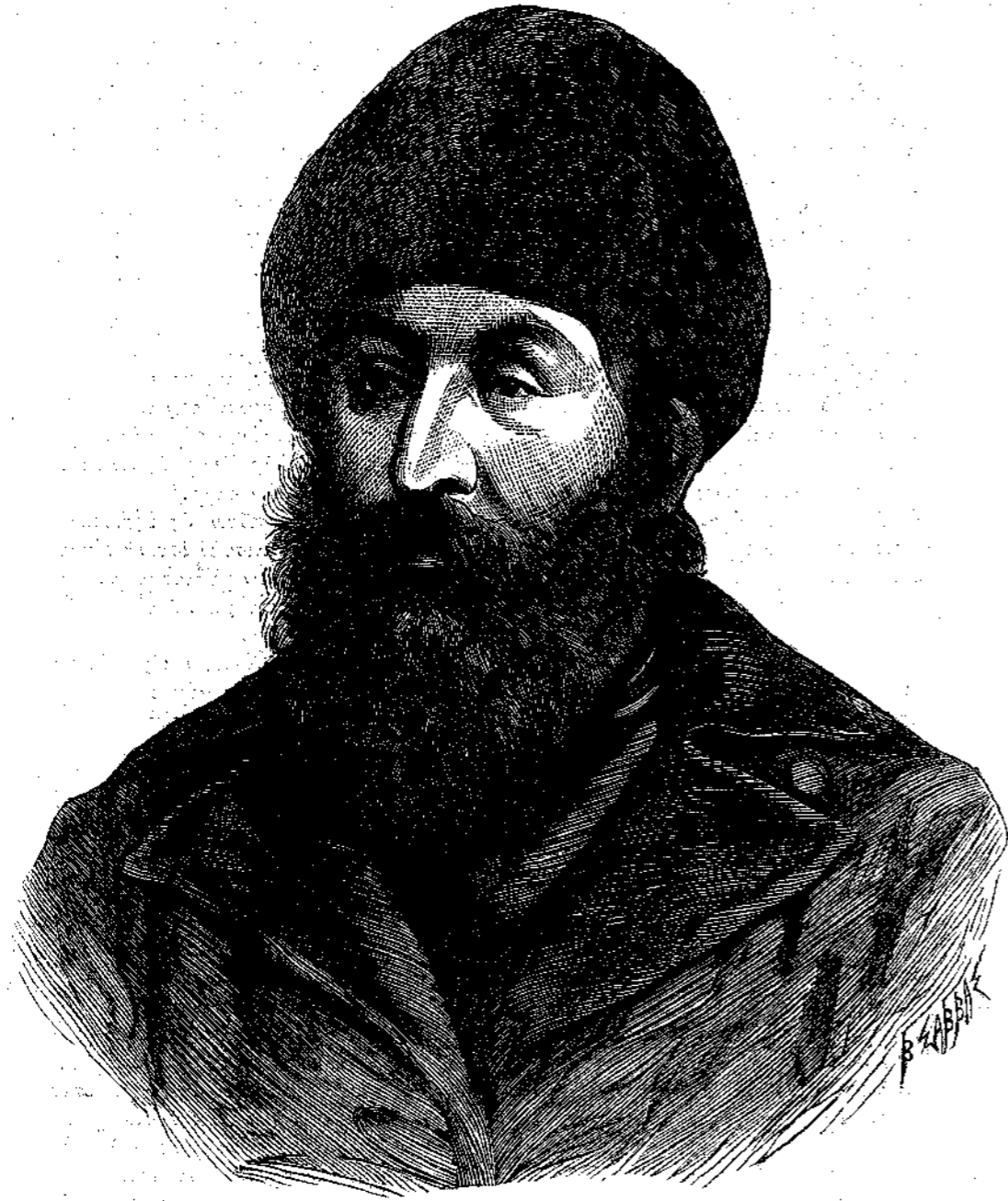
ΣΧΗΡ ΑΛΗΣ, Έμίρης του Καβούλ.

οι Αφγάνες είσι πιθανώς Ιουδαϊκής καταγωγής μετατοπισθέντες εκ τῆς γενετείρας αυτών γῆς υπό του Ναβουχοδονώσορος και άφικθέντες μέχρι του Χεράτ. Έννέα από τῆς εμφάνίσεως του Μωάμεθ ως προφήτου έτη, ούτοι απέστειλαν πρεσβείαν εις Μεδίαν όπως έρευνήση τά κατ' αυτόν ή πρεσβεία δ' αύτη ήσπάσθη