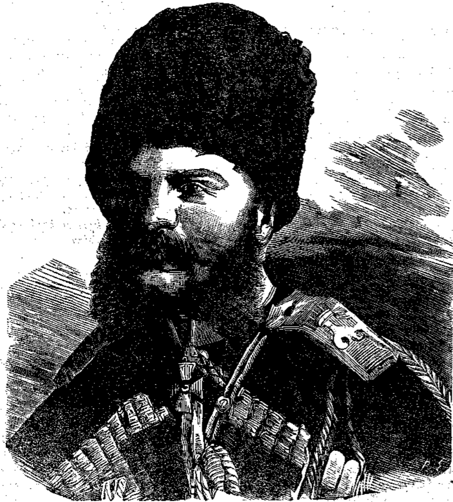
Ὁ Μέγας Δοῦξ ΜΙΧΑΗΛ

τιτὰ τῆς διαρπαγῆς νὰ δικαιολογήσῃ, πρέπει αὐστηρῶς ν' ἀπαγορεύωνται ὑπὸ τῶν γονέων. Τούναντιον δ' ὀφείλουσιν οἱ γονεῖς νὰ παρορμῶσι τοὺς παῖδας πρὸς συλλογὴν ὀρυκτῶν, ἧτις ἀρετῆς καὶ εὐχερῆς εἶναι, μὴ χρήζουσα προπαρασκευαστικῆς τινος ἐργασίας, πάντα δὲ παῖδα τέρπουσα. Ὅθεν ὁ πατὴρ τὰ ὑπὸ τοῦ παιδὸς συνειλεγμένα ὀρυκτὰ ὀδηγεῖ αὐτὸν νὰ θέτῃ ἐν θήκῃς, ὑπ' αὐτοῦ κατασκευασθείσαις, μετὰ τεμαχίου χάρτου, φέροντος τὸ ὄνομα καὶ τὸν τόπον τῆς εὐρέσεως αὐτῶν. Ἐὰν ὅμως ὁ πατὴρ ἀγνοῇ τὸ ἐπιστημονικὸν ὀρυκτοῦ τινος ὄνομα καὶ αὐτὸ τὸ