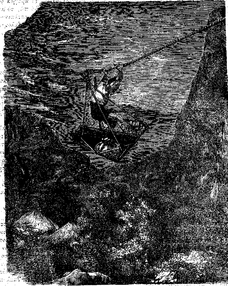
Ἀνάπτυξις τῶν μέσων τῆς συγκοινωνίας ἐν Ἰαπωνίᾳ.

φανταστικὸν χορὸν γύρω ἐνὸς γελοιοποιῶ, ἰσταμένου ἐπὶ τῶν ὤμων δύο συντρόφων καὶ στηριζομένου ἐπὶ δύο μακρῶν στύλων, καὶ ποιῶντος μορφομοίαις καὶ κωμικὰς παρατηρήσεις πρὸς διασκέδασιν τοῦ πλήθους. Κατὰ πρότην ὄψιν φάνηται παράδοξον ὅτι γελοιοποιοὶ ἀναμίγνυνται εἰς θεατρικὴν τελετὴν ἐπὶ παρουσίᾳ τῶν ἀνωτέρων ἐκκλησιαστικῶν λειτουργῶν τοῦ βασιλείου, ἀλλ' ἡ περιεργὸς αὕτη ἀνάμιξις εὐθυμίας καὶ εὐλαβείας δὲν ἐφαίνετο δυσαρτεροῦσα τοὺς