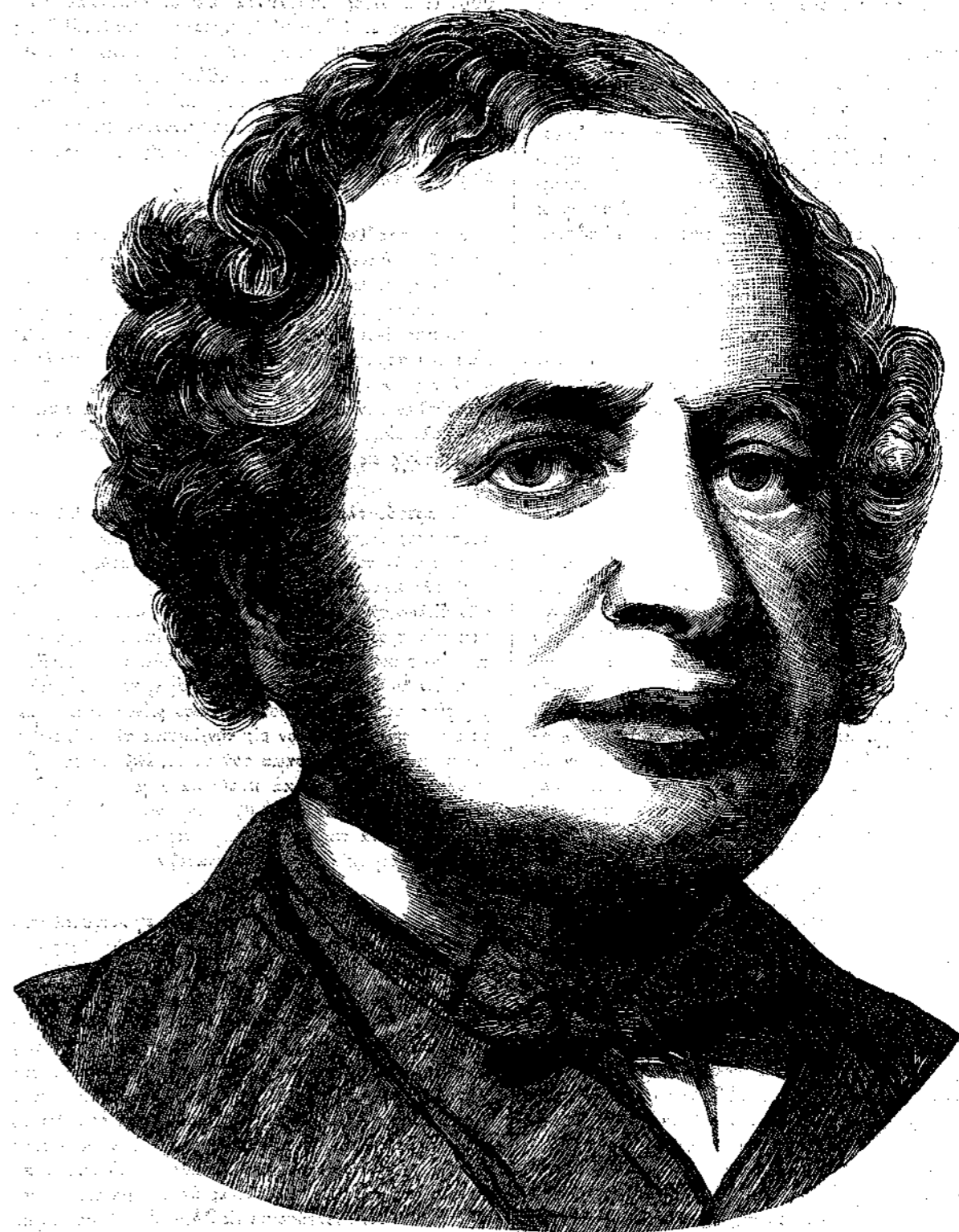
Ο ΚΟΜΗΣ ΓΡΑΝΒΙΑ

'Αγάπα τὸ σκυλάκι σου καὶ θάλλθουν ἄλλοι χρόνια, Νὰ 'θυμηθῆς τὰ λόγια μου, τὸν κόσμο σὰν γνωρίσης, Σὰν σοῦ 'ματώσουν τὴν καρδιά, καὶ τὴν πληγώσουν πόνοι, Αἱ φίλαις σου π' ἰλόφυγα ταῖς εἴχες ἀγαπήσεις. Κάλλιο μονάχη κόρη μου, μὲ τὸ πιστὸ σκυλάκι, Πόσοι δὲν εἶναι φίλοι μας ποῦ στάζουνε φ α ρ μ ἄ κ ι ! Ν. Γ. ΠΓΑΒΗΣ.