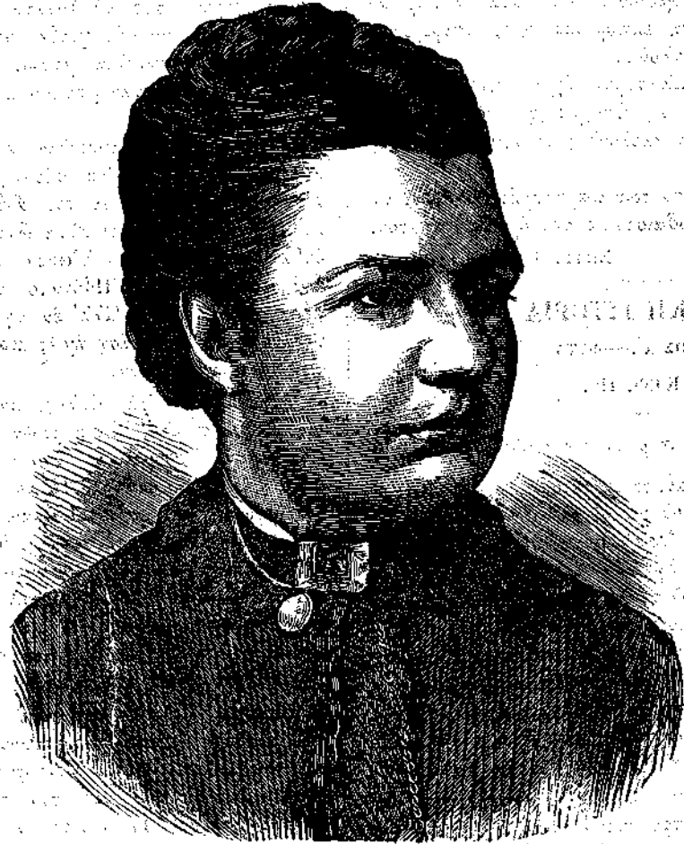
Ἡ μὲν Βέστον.

σεν ἀπὸ τοῦ ἔτους 1868 ἕκτοτε δὲ ἰδρύσθη διάφορα φιλανθρωπικὰ καὶ ἐγκρατείας ἰδρύματα πρὸς περίθαλψιν καὶ ἀναφυγὴν τῶν ναυτῶν ἐν οἷς διατίθονται καὶ ἡμερεύοντες ὅταν δὲν καλῶνται εἰς ἐκπλήρωσιν καθήκοντων ἐν τοῖς πλοίοις τοῦ πολεμικοῦ ναυτικοῦ τῆς Ἀγγλίας, διατελοῦσι μακρὰν τῶν πειρασμῶν τοῦ πότου καὶ ἄλλων συμπαρομαρτουμένων ἐλαττωμάτων. Καὶ πρῶτον πάντων ἤρχισεν ἐπισκεπτόμενη τὰ πλοῖα καὶ διδάσκουσα τοὺς ναῦτας, ὅταν ἐλάμβανε τὴν πρὸς τοῦτο ἀδειαν, ἥτις τὸ κατάρχαι μὲν δὲν ἐδίδοτο εὐκόλως ἀλλὰ μετὰ ταῦτα, γνωστῶν