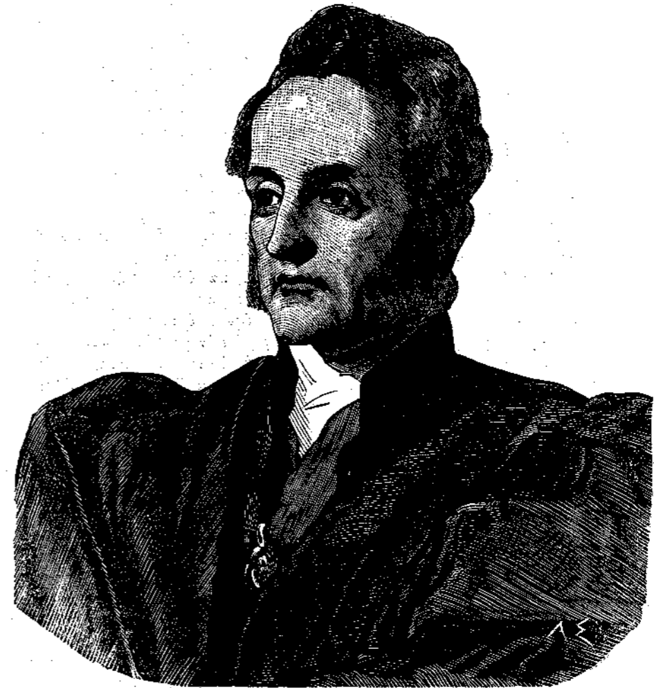
Ὁ ΔΡ. ΣΤΑΝΒΟΥΡΥ

ἀρὸς Στάνλεϋ ἤρξατο τῶν θριάμβων ἐν ταῖς κολλεγιακαῖς καὶ πανεπιστημιακαῖς σπουδαῖς. Τὸ 1845 διωρίσθη κήρυξ τοῦ θείου λόγου, οἱ λόγοι δ' αὐτοῦ βαθεῶς εἰκόνουν τὰς διανοητικὰς καὶ θρησκευτικὰς συμπαθείας τῶν κείνων οἵτινες συνηθραίζοντο ὅπως ἀκούσωσιν αὐτοῦ. Ἀπὸ τοῦ 1850 μέχρι τοῦ 1852 ἦτο γραμματεὺς τῆς πανεπιστημιακῆς ἐπιτροπῆς τῆς Ὁξφόρδης, καὶ διαρκούσης τῆς περιόδου καθ' ἣν κατεῖχε τὴν θέσιν ταύτην διωρίσθη καὶ εἰς ἄλλας