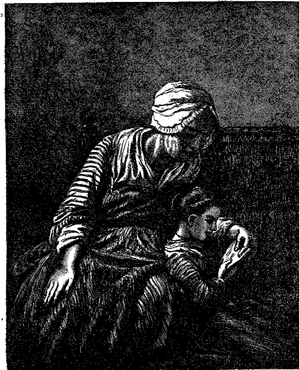
Η ΚΑΛΗ ΜΗΤΕΡΑ

Τί χαρὰ εἰς τὴ μητέρα Ὅταν κάθεται μαζὺ Καὶ διαβάζει τὸ παιδί τῆς Κάθε βράδυ, κάθε ἡμέρα. Τὸ βιβλίον ὅποιος ἀφίνει Καὶ τῆς τρέλλαις κυνηγᾷ