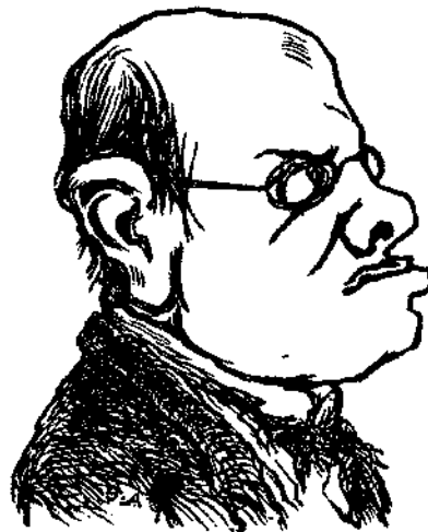
Τύπος τσιγχογράφου, ὑποτάξαντος τρεῖς ἐπιστήμας.