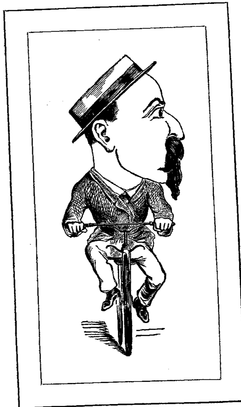
Ὁ ἀεικίνητος ἄργος.