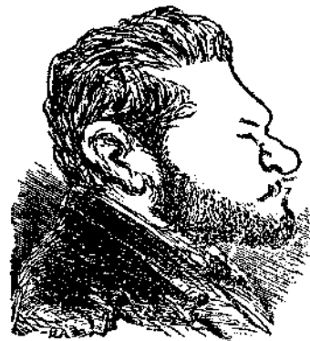
Noch ist Polen nicht verloren (Γερμανικὴ παροιμία: Δὲν ἐχάθη ἔτι ἡ Πολωνία).