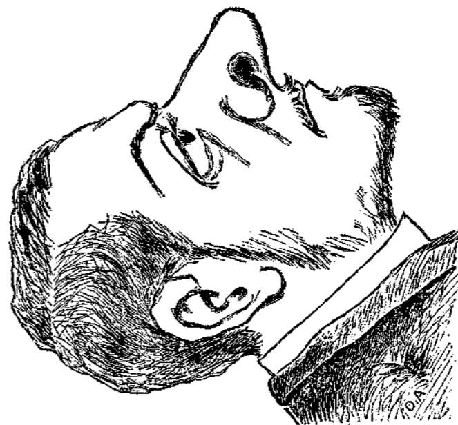
Un baryton de l'avenir.