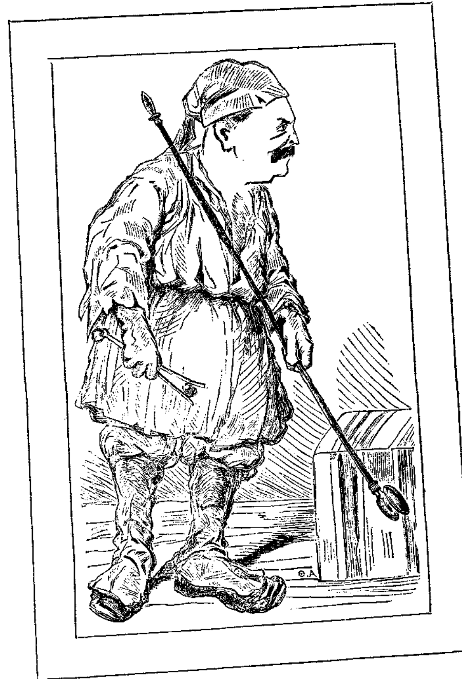
Πρῶτη βαθμὶς πολιτικοῦ σταδίου.

Πολλάκις εὐθυμῶν ὁ αὐθέντης του μετὰ τῶν φίλων του, ἔρριπτεν ἐκ τοῦ παραθύρου Θηρσειανὸν τάλληρον εἰς αὐλὴν τινα, ὅπου χῆνες καὶ νῆσαι ἐπαιζον ἐν τῷ βορβόρῳ. Ἐπειτα δὲ προσέφερε τὸ νόμισμα ὡς δῶρον τῷ ἱποκόμῳ του, ἀν ἐλάμβανεν αὐτὸ ἐκ τῆς λάσπης, διὰ τοῦ στόματος ὅμως καὶ οὐχὶ τῶν χειρῶν, καὶ ὁ ἐρωτόληπτος νεα-