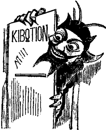
Τελευτάται λέξεις μεγάλων (ὡς λέγουσιν οἱ ἴδιοι) ἐν ὕμῳ.