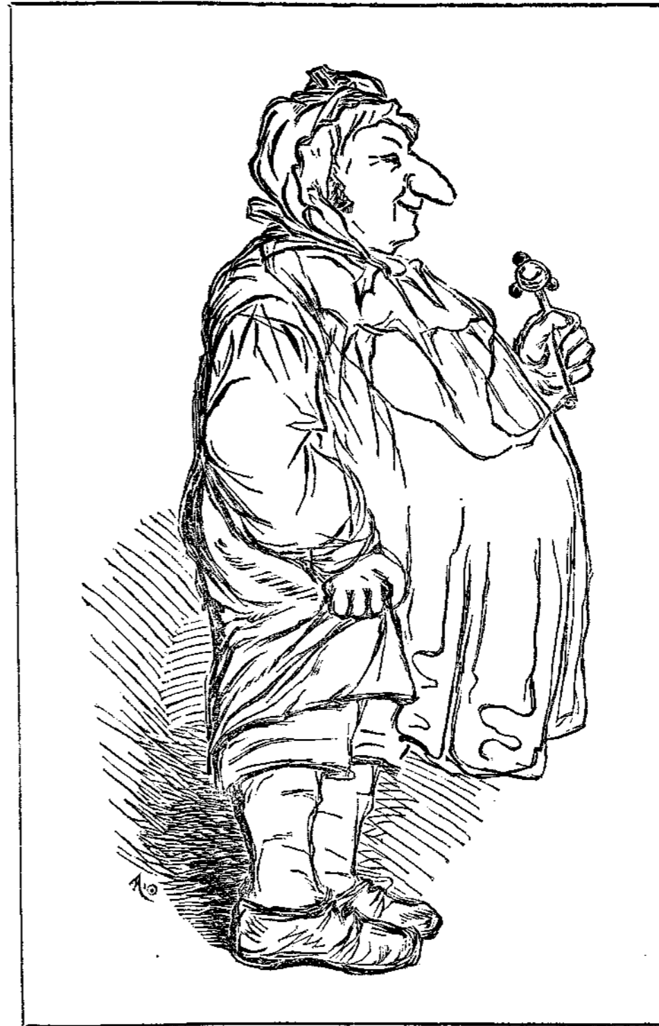
Εἰσηγητὴς γαλλικοῦ πολιτισμοῦ.

Ἐν τῷ «Πρωτῷ Κήρυκι» ἀναγινώσκομεν. «Ὁ Δουξ τῆς Ὠμάλης πρόκειται νὰ συζευχθῇ τὴν Λαταίδα πριγκίπισσαν Θήραν». Εὐχόμεθα αὐτῷ καλὸν πῖθον.