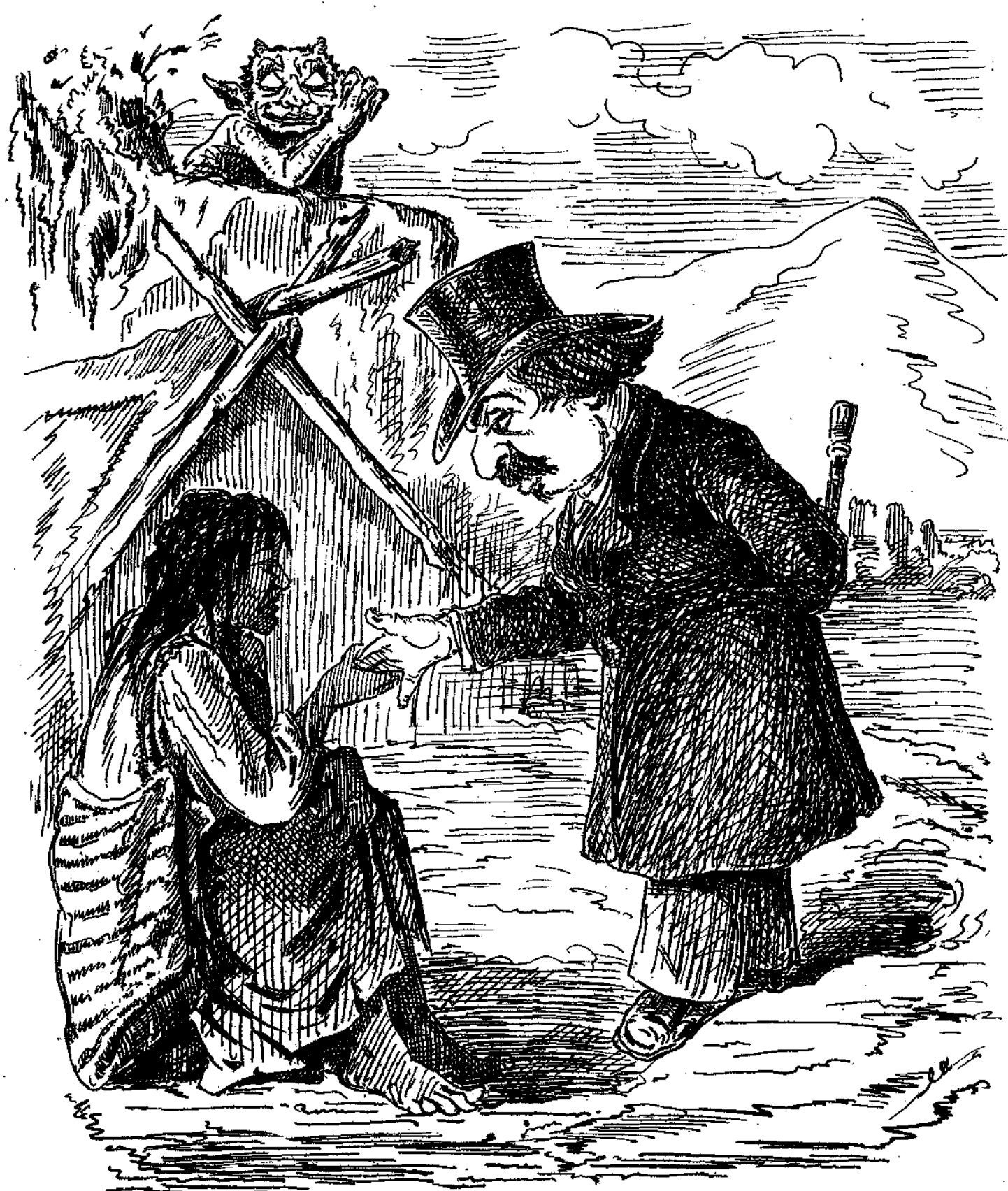
ΠΡΟΡΗΣΙΣ ΤΗΣ ΜΟΙΡΑΣ ΜΕΓΑΛΟΥ ἈΝΔΡΟΣ...

Ἡ « Ἐφημερίς » εὔρε παραδόξον τὴν ἀπειλὴν καθηγητοῦ τινος, εἰπόντος ὅτι ἐν ἀνάγκῃ θέλει ὑποστηρίξει τὴν παράδοξον τοῦ κ. Πύρλα καὶ διὰ τῶν ὕπλων. Τὸ τοιοῦτον ὅμως ὄχι εἶναι ὅλως πρωτάκουστον. Ἐν Βοημία κατὰ τὸν μεσαιῶνα εἰς τὰς περὶ Μετουσιώσεως παραδόσεις τῶν ὀρθοδόξων διδασκῶν παρίσταντο οὐ μόνον οἱ στρατιῶται, ἀλλὰ καὶ ὁ δῆμιος μετὰ σχολίου,