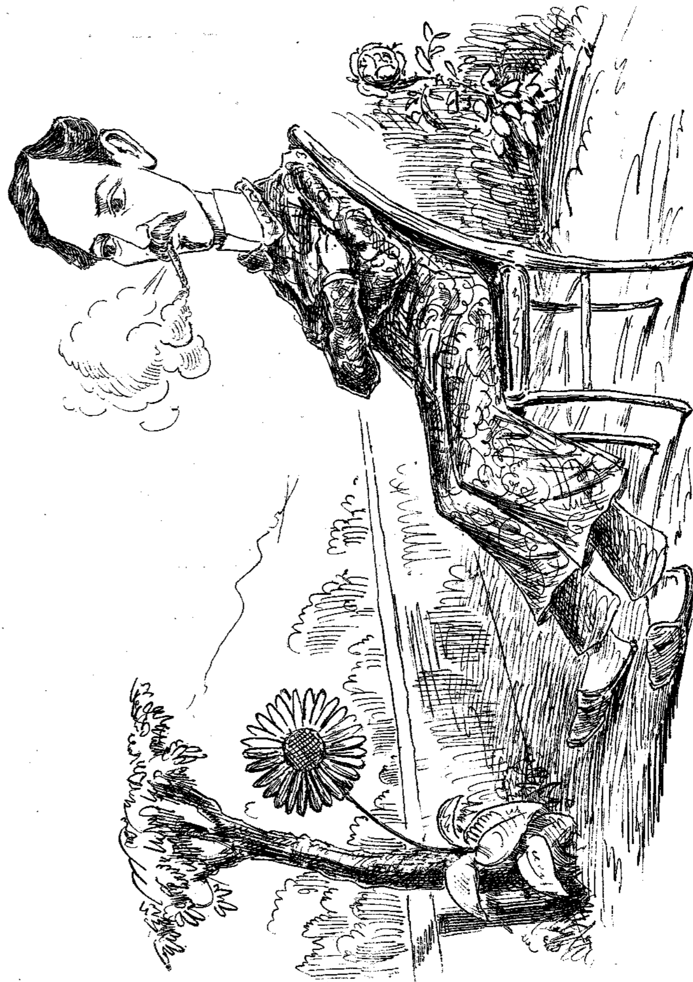
Ὁ νέος Κιγκινάτος.

Τοιαῦτα εἶναι τὰ ἀποτελέσματα τῆς ἐφευρέσεως ταύτης τῆς εταιρίας διὰ τὸν οἰκογενειάρχην. Ἴσως νομίζετε ὅτι ὡς μέτοχος τοῦλάχιστον πρέπει νὰ ἦμαι εὐχαριστημένος, ὡς μέλλον ἐκ τούτου νὰ λάβω ἀνώτερον μερίσμα. Πολλὸ ὅμως