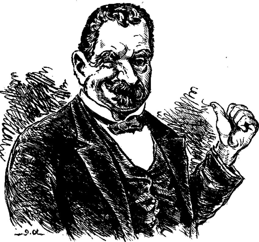
Γιὰ 'πὲς ἀλεῦρι;....

— Πᾶμε στὸν Ἀπόλλωνα; — Καλλίτερα ἐστὶ κ' ἀνόνι νὰ μυρίσωμε καὶ μπα- ροῦτι.