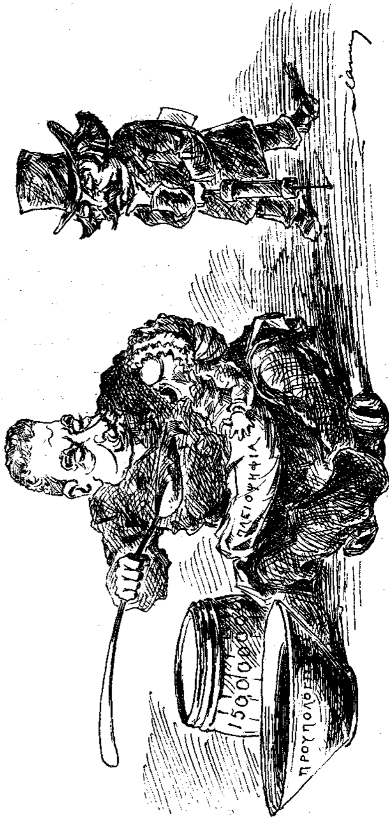
«Έκτακτος τροφοδοσία και τακτική θεραπεία.»