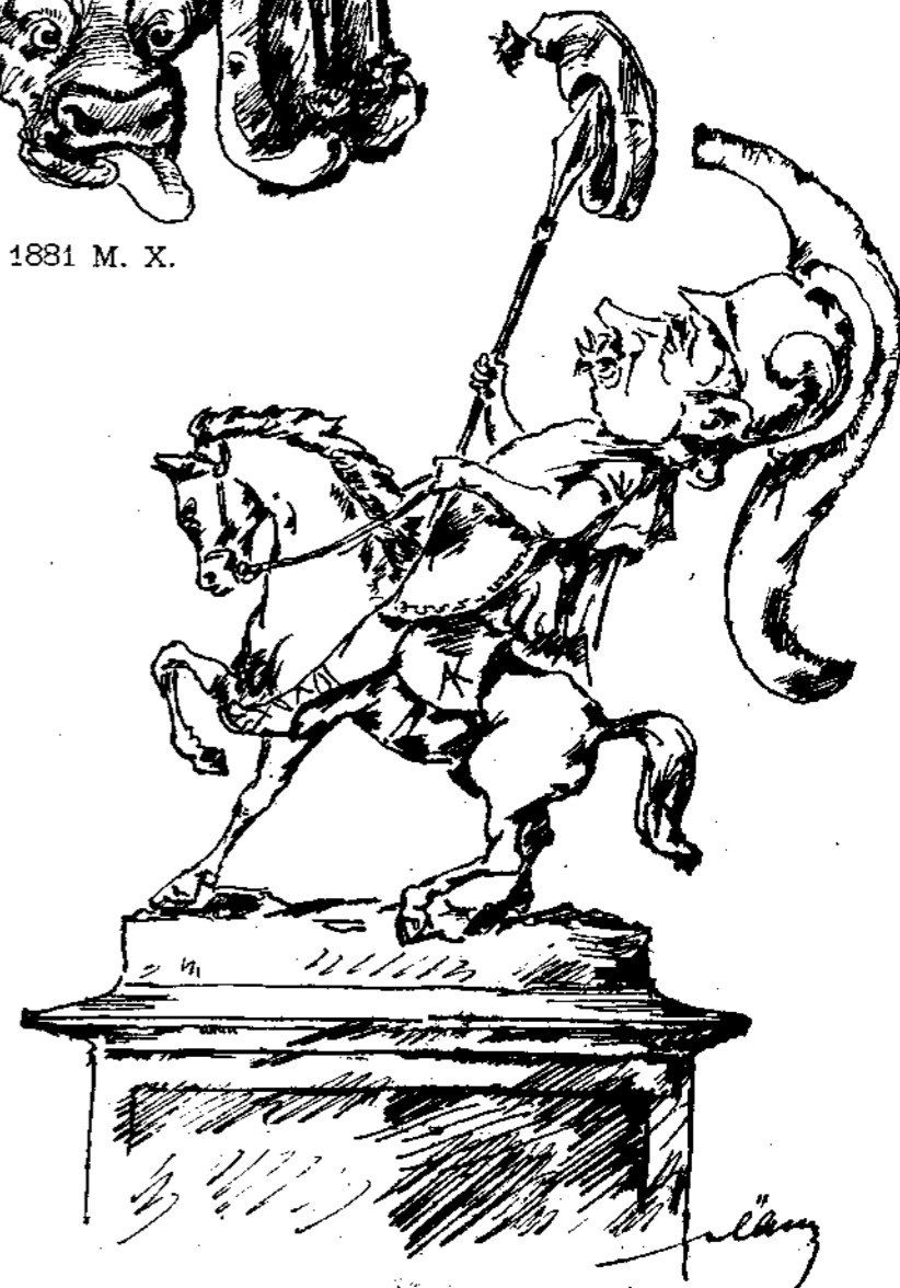
Η ΠΑΤΡΙΣ ΕΥΓΝΩΜΟΝΟΥΣΑ