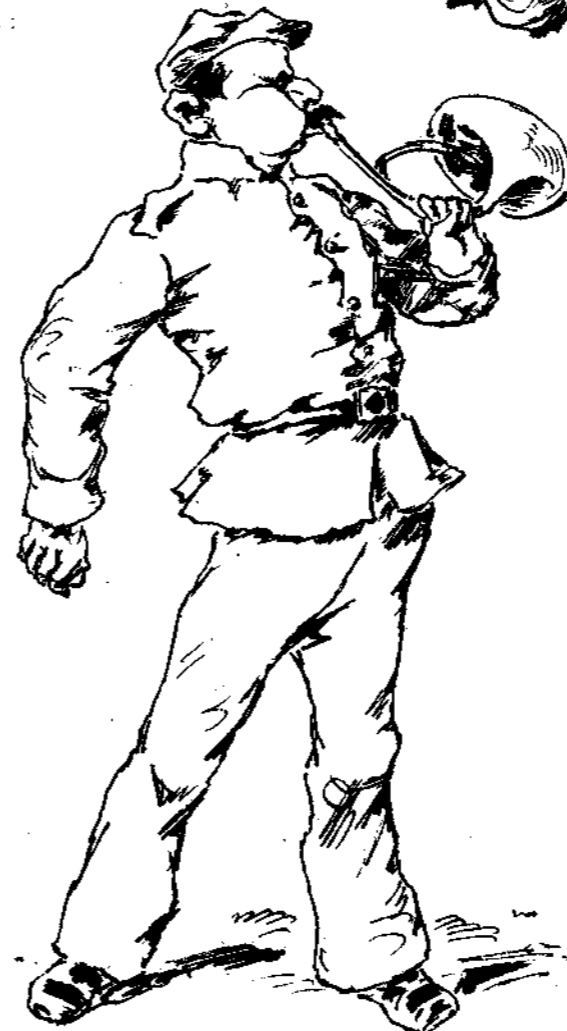
Malbrough s'en va-t-en guerre