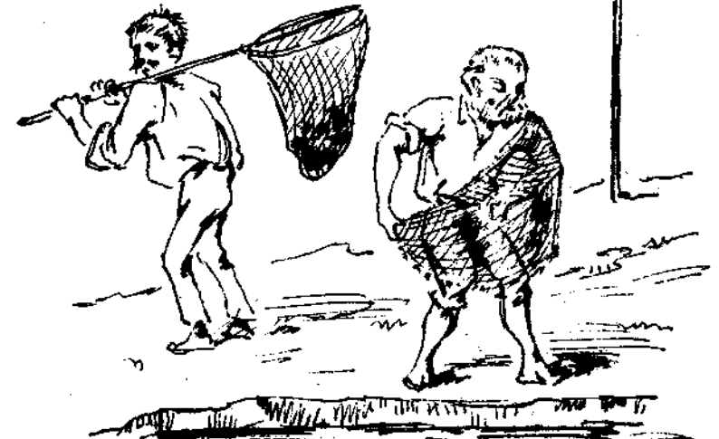
Εἰς ἀναζήτησιν λειψάνων κολυμβητῶν.