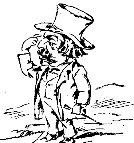
Εἰς ἀναζήτησιν ἰδεῶν διὰ τοὺς ἐπιμηνοῦς Παραφοίτους.