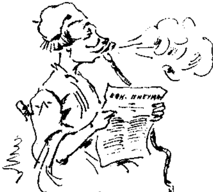
Εἰς ἀναζήτησιν ἐθνικοῦ πνεύματος.