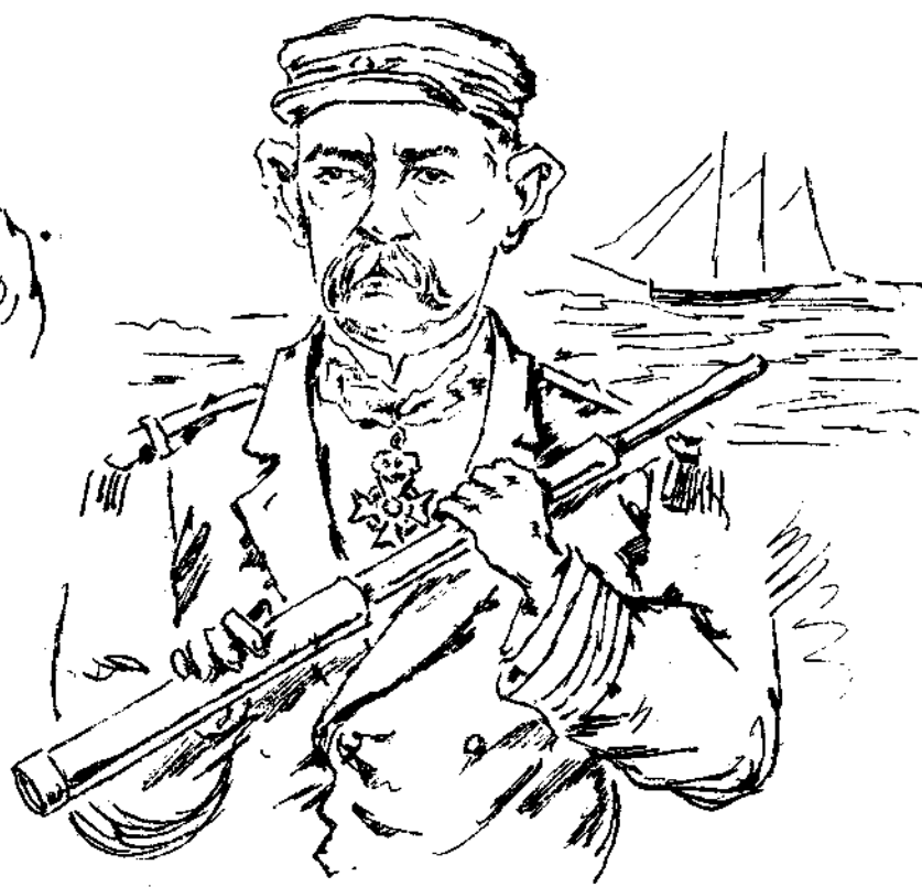
Εἰς ἀναζήτησιν τουρμινοῦ στολοῦ.