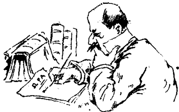
Εἰς ἀναζήτησιν λέξεων πρὸς ἀναστάσιον.