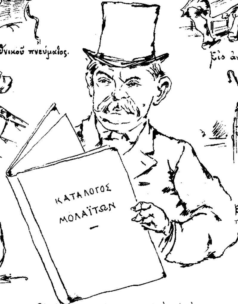
Εἰς ἀναζήτησιν τοῦ συντάκτου τῆς Ἐφημερίδος ἀπὸ Ὑμηττοῦ μέχρι Πειραιῶς.