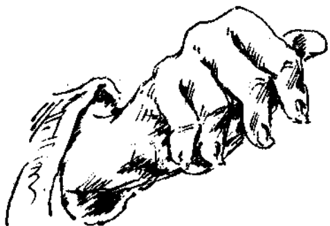
Εἰς ἀναζήτησιν ταμείου.