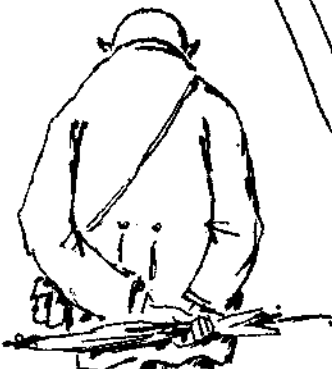
Εἰς ἀναζήτησιν νόμου ἐν τῷ ἐξωτερικῷ.