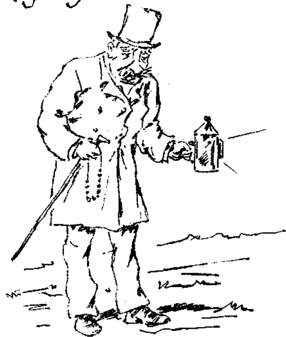
Εἰς ἀναζήτησιν ἠθικοτήτων.