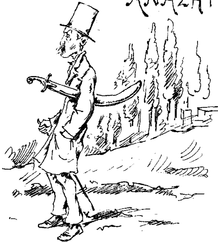
Εἰς ἀναζήτησιν ματαλλήλου τοποθεσίας δι' αὐτονομίαν.