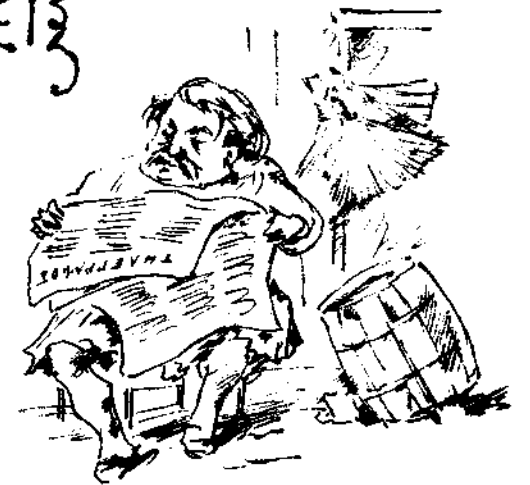
Εἰς ἀναζήτησιν οὐσίας.