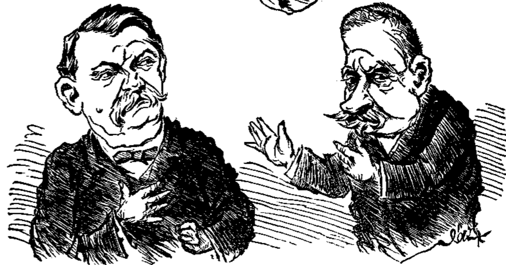
Ἡ σπάθη τοῦ Τομαροκλέους ἢ τὰ ἐπίσημα ἔγγραφα τοῦ κυρ Γιάννη.