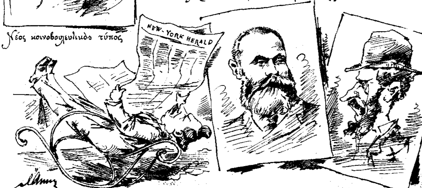
Ὡς ἐβγήκε βουλευτὴς