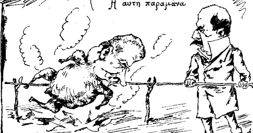
Μετὰ τὴν πρώτην συνεδρίασιν τῆς Βουλῆς