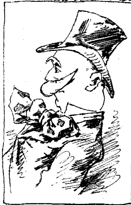
Νέος κοινοβουλευτικὸς τύπος