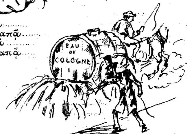
Τό μόνον μέτρον όπερ ήβεν ή επί 'Ογείας τής πάγκως έπιτροπή.