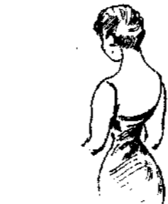
Decolletée του θυρμού.