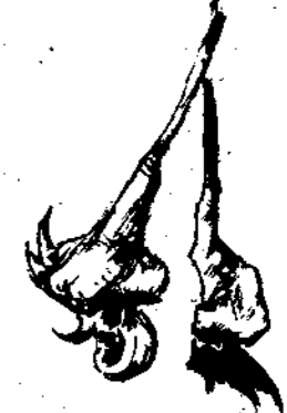
Μύται της έποχής.