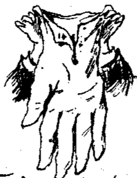
Τό άπολεσθέν γάντι της Κυρίας.....ευρέθη.