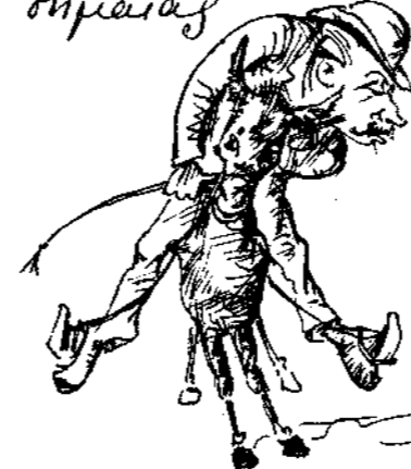
Ὁσὶν λὴν οὐκ ἔστιν ἡ σφραῖσα