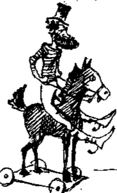
Ἡ πρῶται δουραὶ