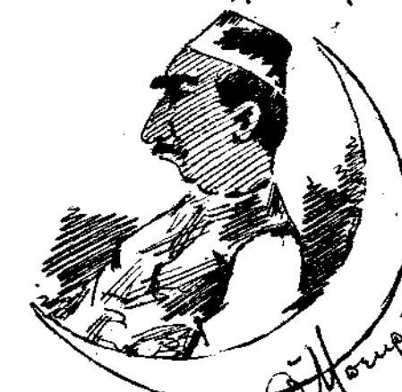
Ο Μουρ'ε φ'αν'ω