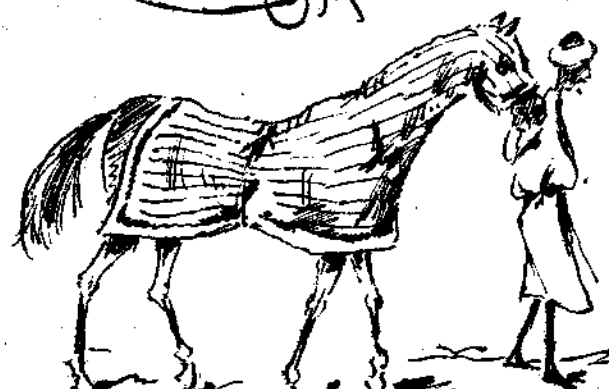
Ο γ'οοσι του Μουρ'ε φ'αν'ω