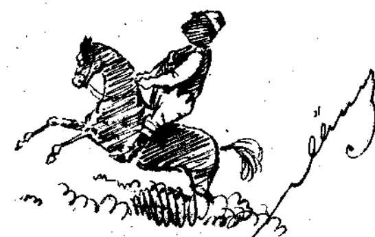
Πρώτος εν Σμύρνη εν τ'ο χωρ'ά εν 'Αθήναις