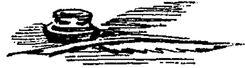
Τὶ δὲ καὶ εἰς τρίτην παράξιν