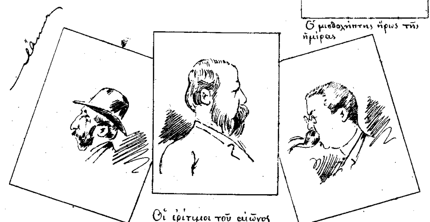
Οι έριτίμοι του εΐώνος