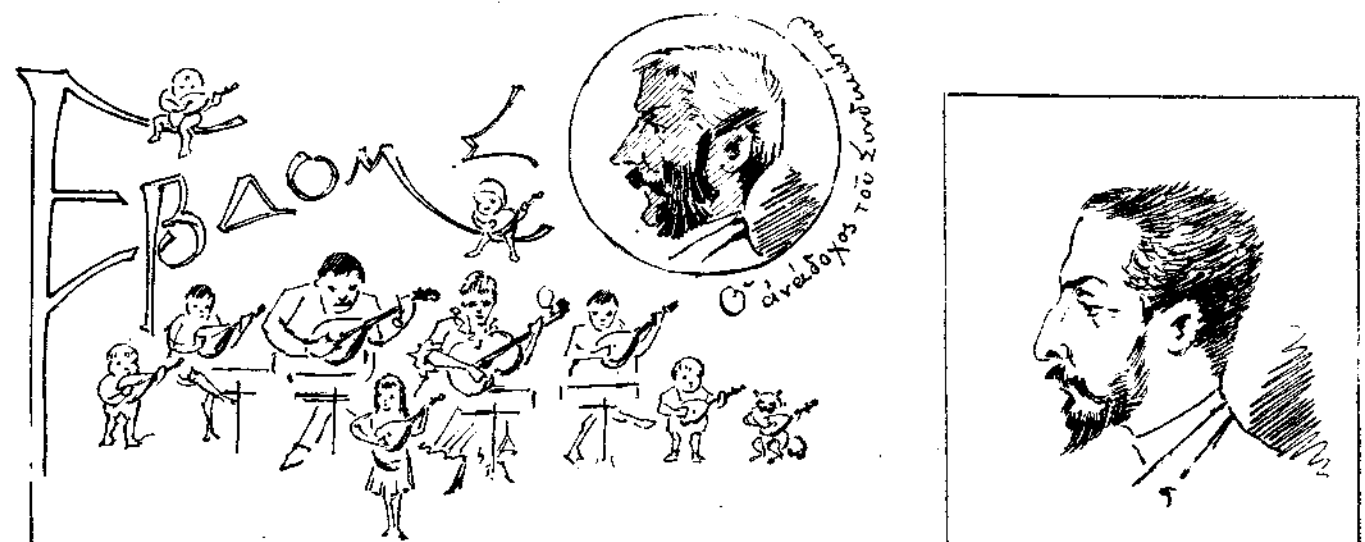
Ο μισοκρίπτης ήρως της ήμερας