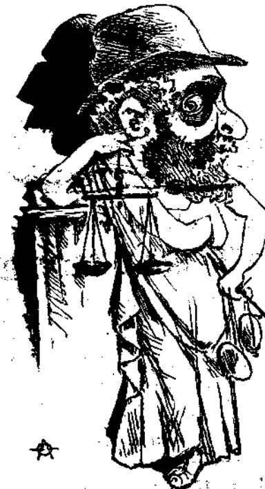
Η Θεία έν Αθήναις