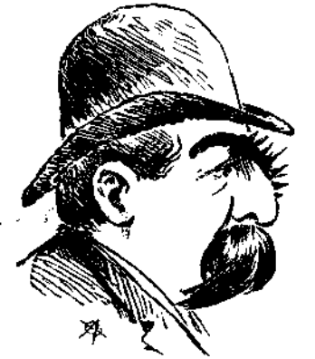
Ο Πρόεδρος των παρ' Εφέταις κερβέρων