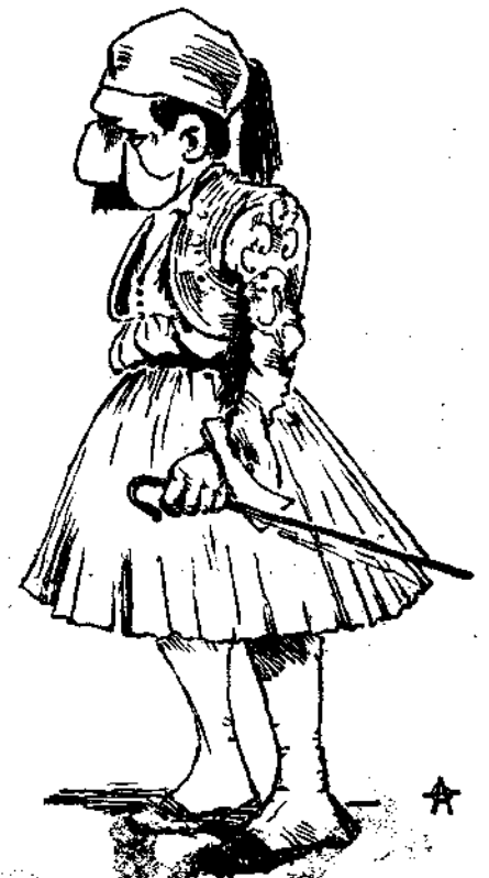
Ισογυία έν Πελοπόννησον