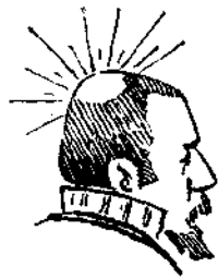
Ὁ ἀστὴρ τοῦ Πρωεδρείου