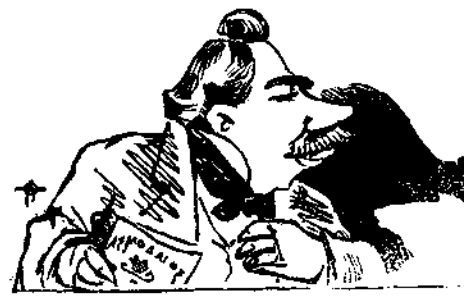
Ὀπτικὴ ἐν τῇ Βουλῇ