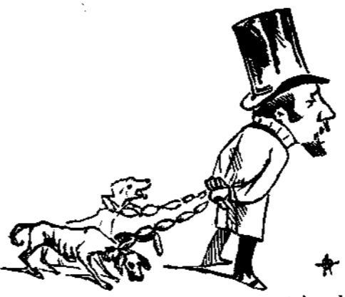
80 λεπτὰ ἢ ὀκτὰ τὸ κρέας... Ἦλθεν ἡ ἐποχὴ ποῦ δένουν τὰ σκυλιὰ μὲ τὰ λουκάνικα