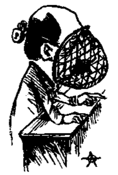
Μέτρα προφυλακτικὰ κατὰ τῆς ὑβροφοβίας