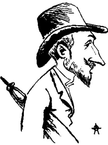
Ὁ ἐφευρέτης τοῦ Καπετὰν Ἀνδρέα