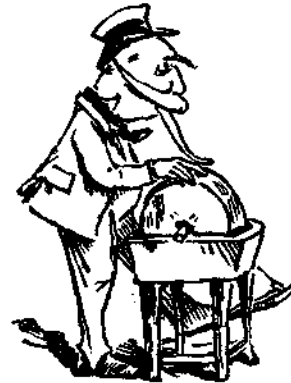
Διὰ τὰ ὁμιλήσῃ