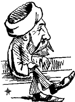
Διὰ τὰ μὴ ὁμιλήσῃ