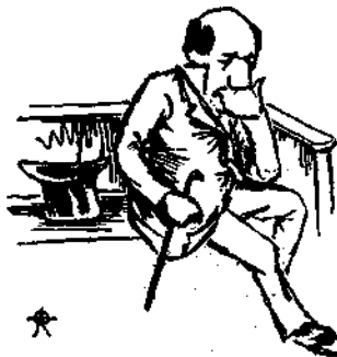
Διαρκῶντος τοῦ λόγου Δεληγιώργη