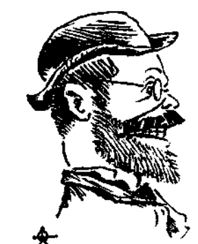
Διδάσκων μαθημάτων άνεξαρτητίας και εύπρεπειας