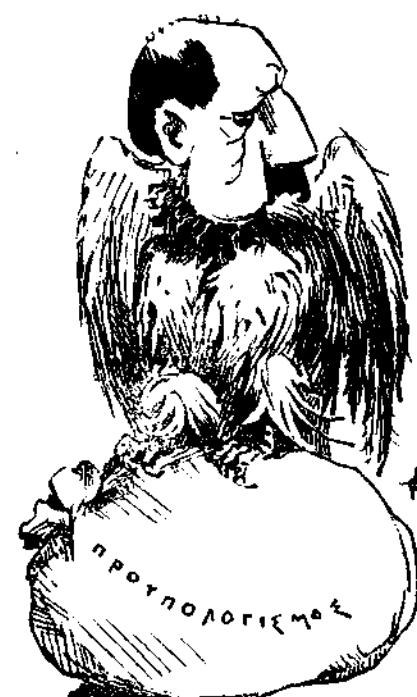
Μεταμψύχων εις γόπα