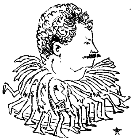
Τό τέρας της τριανταμελούς επιτροπής