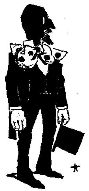
Έν τω άνατολικώ γορφε