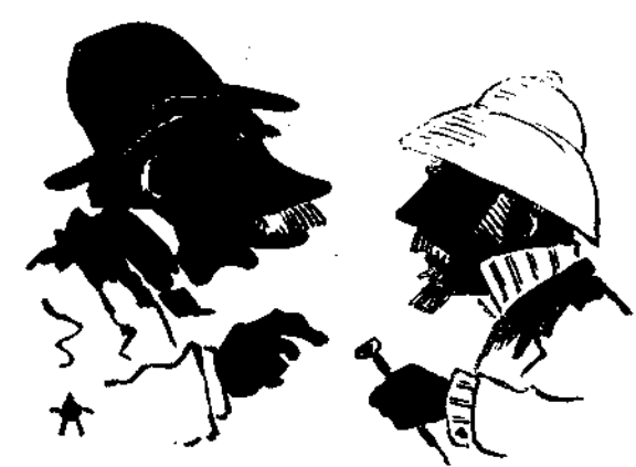
— Εί, την Γερμανίαν... — Θέλατε να είπητε εις την Αμερικην; — Όχι! ύπεραν από την έθεσιν του Νικολσον ή Γερμανία διά της Αγγλοαμερικης.