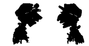
— Είς την Βουλή είπαν πώς δεν έχομε ύπαξιωματικούς. — Ο Τρικούπης απήντησε πώς αυτό γίνεται και εις τούς Παρισίους.