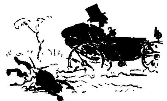
Τούλάχιστον τώ άνήκει ή άμαξα... κατά τον Δουζίνου.