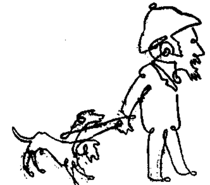
Πρωτοχρονιάτικη τριουπόστατος μονοκονδυλιά.