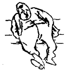
Ἐπὶ τρεῖς ἔτη λέγει νὰ ἰ καὶ εἰς τὴν αὐτὴν θέσιν