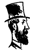
Πρὶν φθάσῃ εἰς τὴν καθηγητικὴν ἔδραν πόσα ἐπήδησε παλούκια!

Ποιητῆς ἀκροστιχίδος κατὰ τὸ 1862 καὶ εἰς ἀμοιβὴν τμηματάρχης καὶ δργανωτῆς τῶν ἐγκαθέρτων εἰς τὴν βουλήν κατὰ τὸ 1884.