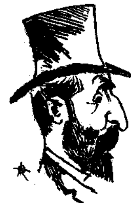
Γούψ, γέννημα καὶ θρέμμα τῆς Κωνσταντινουπόλεως περὶν ὡς Ἀθηνῶν