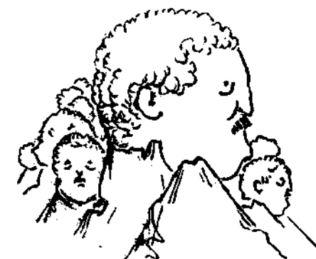
Πρότυπον σφραγίδος διὰ τὸν «Παρνασσόν»