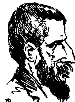
Ὁ Καπετάνος τῶν μετὰ Χριστὸν προφητῶν