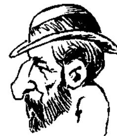
Ἐρευρέτης τοῦ δασμολογίου καὶ τῆς Μελλίσσης