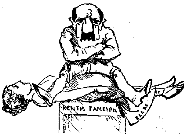
Αλήτης άρσις δέν έγινετο

«Την νύκτα ταυτην θέλομεν κοιμηθή ύπνον έχοντα σχέσιν προς δύο έτη, διότι έν τη αυτη νυκτι έκπνεεί το 1884 και γεννάται το 1885. Την πρώην της αύριον έξυπνούντες θά λέγωμεν το χθές πέρισυ και το σημερον έφέτος. Έν τούτοις ός εύχρηώμεν όπως το 1885 εινε έτος γόνιμον ύρ' όλας τας ετόψεις, και δυνηώμεν νά εγκαταλείψωμεν το έγωιστικόν ΕΓΩ, και συσσωματούμενοι δεσθεν του προοδευτικού, του ύψηλου, του πάντα δυναμένου νά κατοθήση ΗΜΕΙΣ, ίνα διά του ΗΜΕΙΣ και διή των ίδιων μέσων ανυψώσωμεν και την προσφιλή μας Έρμυπόλιν και την δλην ΠΑΤΡΙΔΑ.»