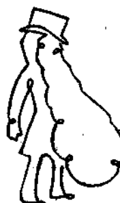
Μια μονοκονδυλιά καθ' έβδομάδε