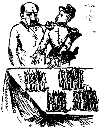
Συνενόησις περί του στρατοπέδου