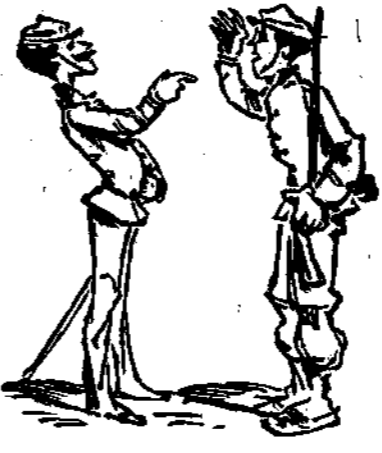
— Ὅταν φέρουν ὄπλον δὲν φέρουν τὸ σχῆμα μετὰ τὸ χερί. — Ὅταν κύρ λοχάγε πεινάει κανεὶς δὲν ἔχει τί κάνει.