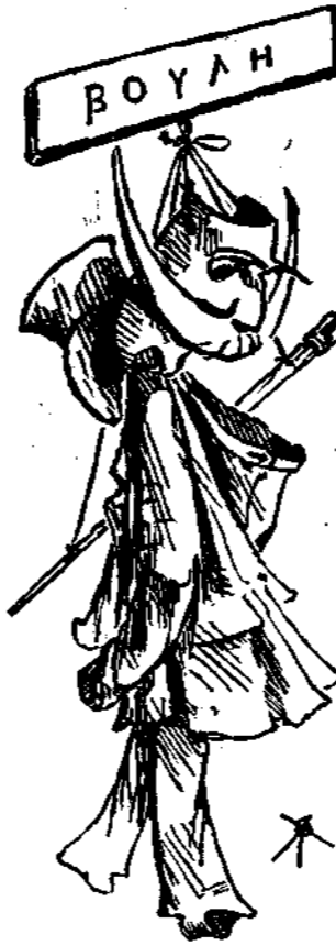
Ἐνοικίσις κοστωμίων. Αἱ εἰσπράξεις ὑπὲρ συντηρήσεως τῆς συμπολιτεῦσεως.