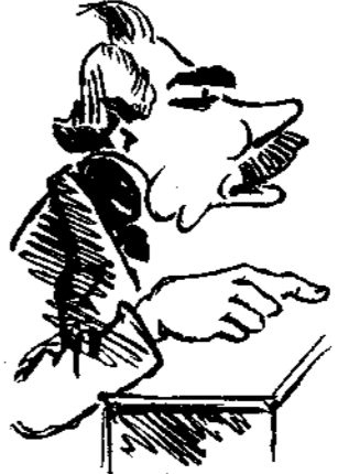
Ἐν Ἀμερικῇ τὸ ζήτημα τῆς Μισσαλίας ἐπὶ ὁμοίας περιστάσεως τοῦ ἐπισποδίου Νικόλων...