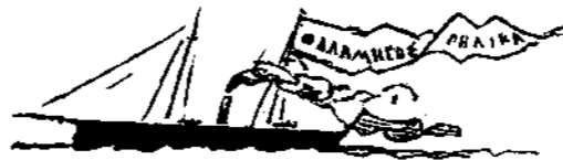
Νεώτερα κυβερνητικὰ παραγγελιαί.