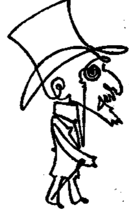
Μία μονοκονδυλιὰ καθ' ἑβδομάδα.