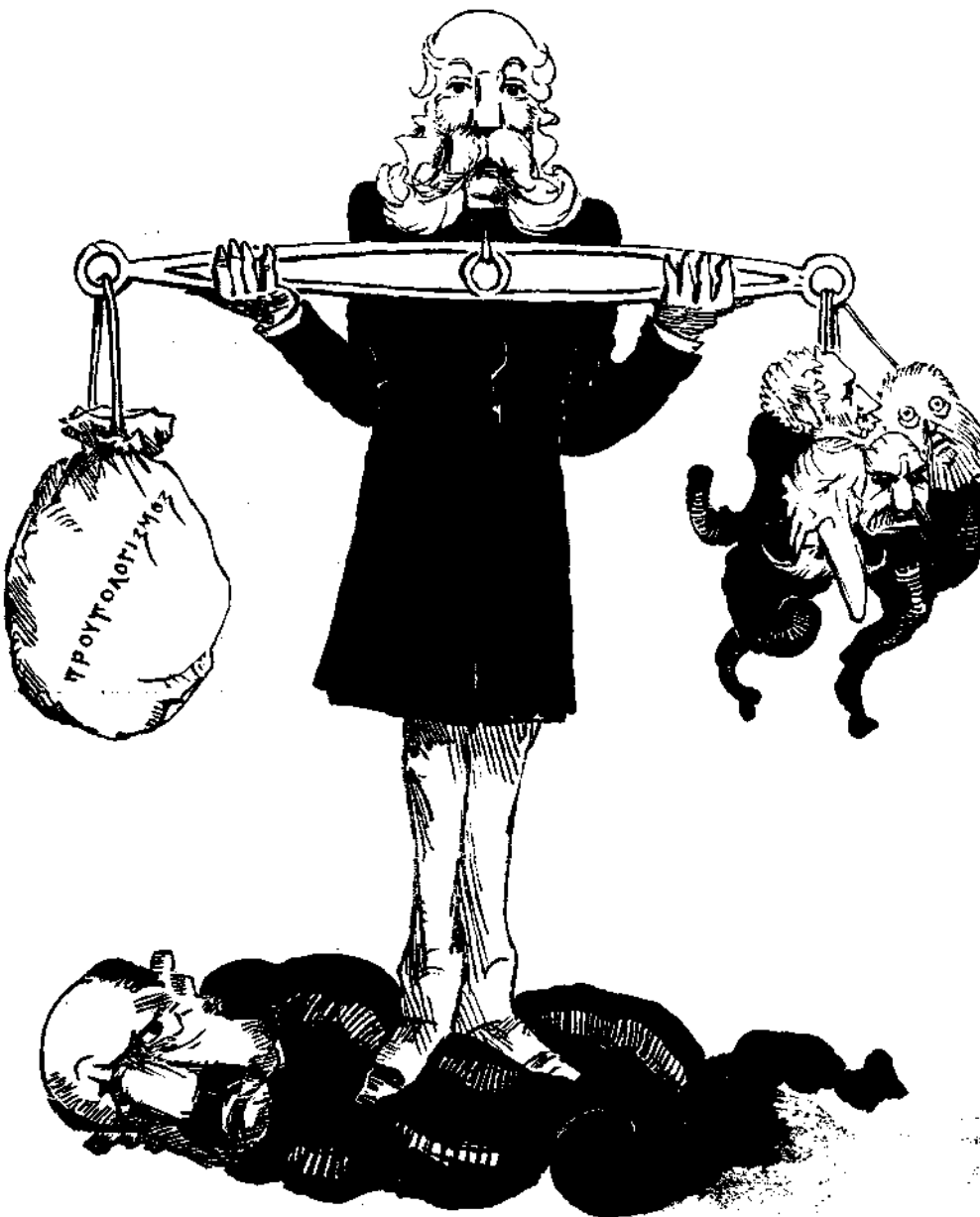
Τὸ ἀληθὲς ἰσοζύγιον

Κατὰ τῆς ἐκδηλώσεως ταύτης τῶν αἰσθημάτων τοῦ λαοῦ ὁ παρητημένος πῆλο κ. Τρικούπης ἀντιτάσσει τὴν δημοσίαν δύνα- μιν, τοὺς κλητήρας του καὶ τοὺς ἱππεῖς του. Περὶ Φιλίππου τοῦ Β' τῆς Ἰσπανίας διηγούνται δι' ὅσα ἀφῆρουντο ἀπὸ τοῦ βασι- λείου του κτήσεις καὶ ἀποικίας, τὸσους νέους τίτλους προσέθεταν εἰς τὸ ὄνομά του. Ἀπαρράλλακτως ὅσον ἐλαττοῦται ἡ ἐξουσία τῶν μέχρι τοῦδε διοικούντων ἡμᾶς, τόσῳ μεγαθύνεται ἡ θρασυτέρας των